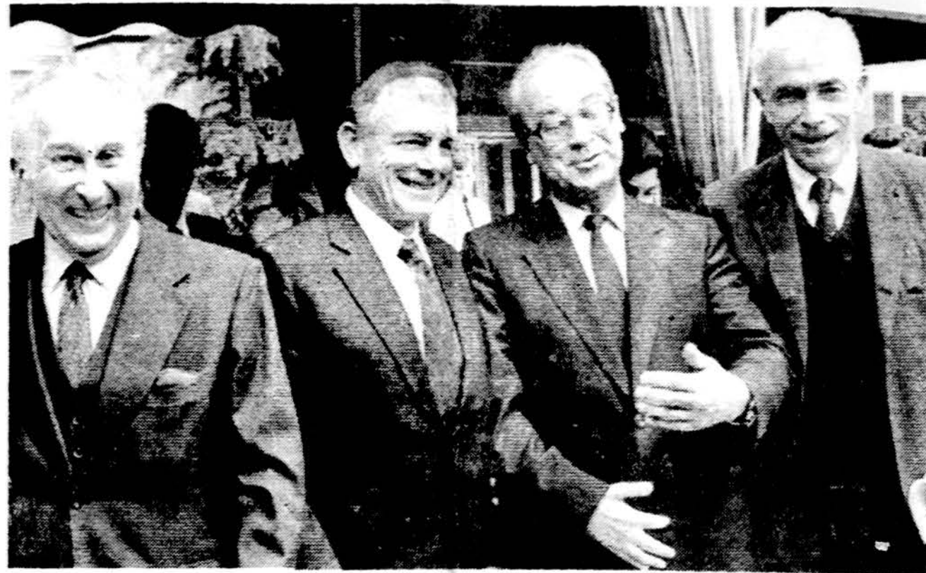
Sovietų Sąjungos delegacijos vadovas Yuli M. Vorontsov, antras iš dešinės, kalbasi su JAV senatoriais, prieš pradėdamis pasitarimus nusiginklavimo reikalais Genevoje. Kairėje Amerikos delegacijos vadas Max Kampelman, šalia jo sen. J. Bennett Johnston, o pačioje dešinėje sen. Clairborne Pell, kuris yra Užsienio reikalų komiteto pirmininkas.