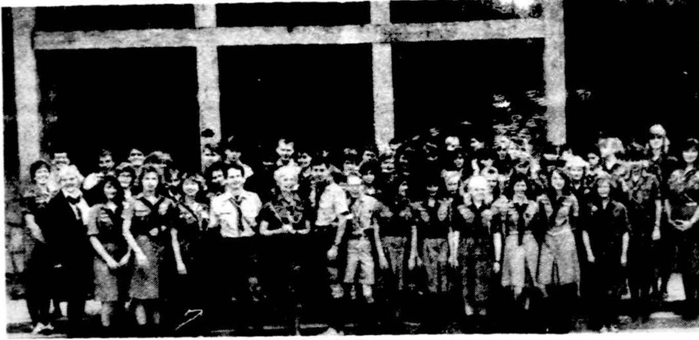
„Šiuo keliu eik!“ – skautiškų Susitiktuvėjų dalyviai.