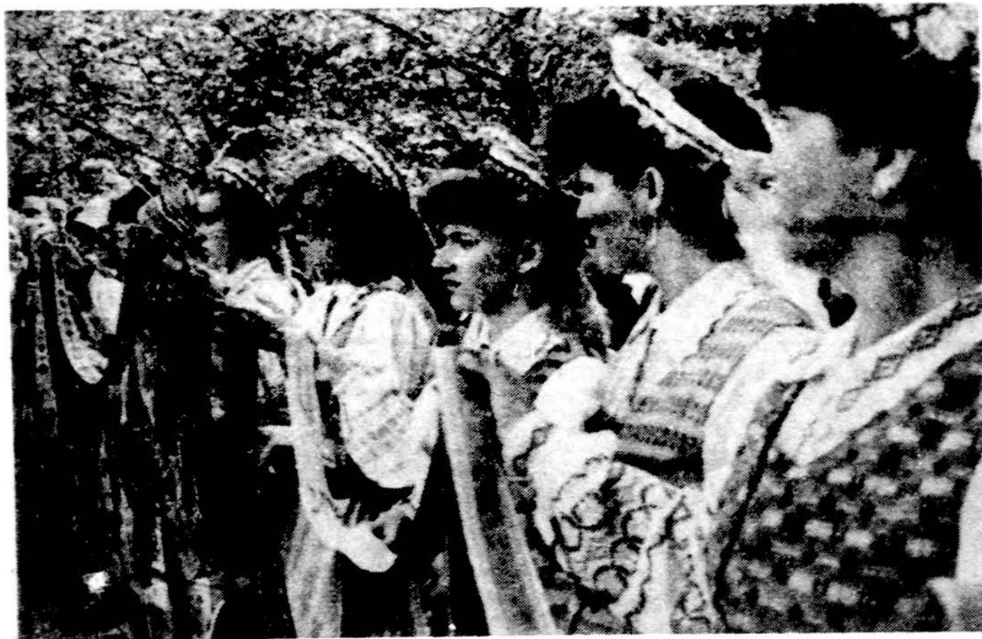
Hartfordo šokėjos per iškilmingą Lietuvos krikščionybės sukakties minėjimą.