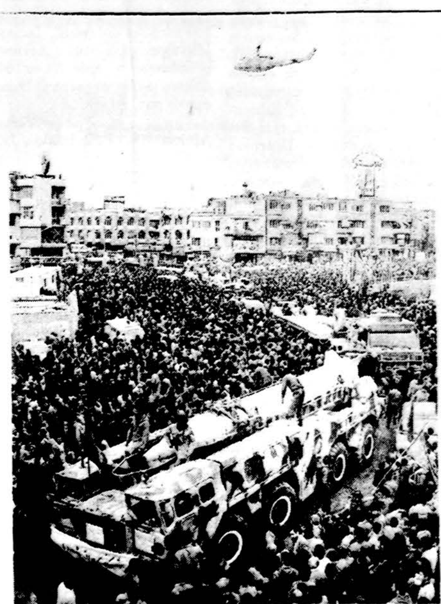
Iranė Teherano gatvėmis parodujamos Revoliucines gvardijos raketos bei kiti karo pabūklai.

Saulė teka 5:19, leidžiasi 8:29. Temperatūra diena 81 l., naktį 60 l.