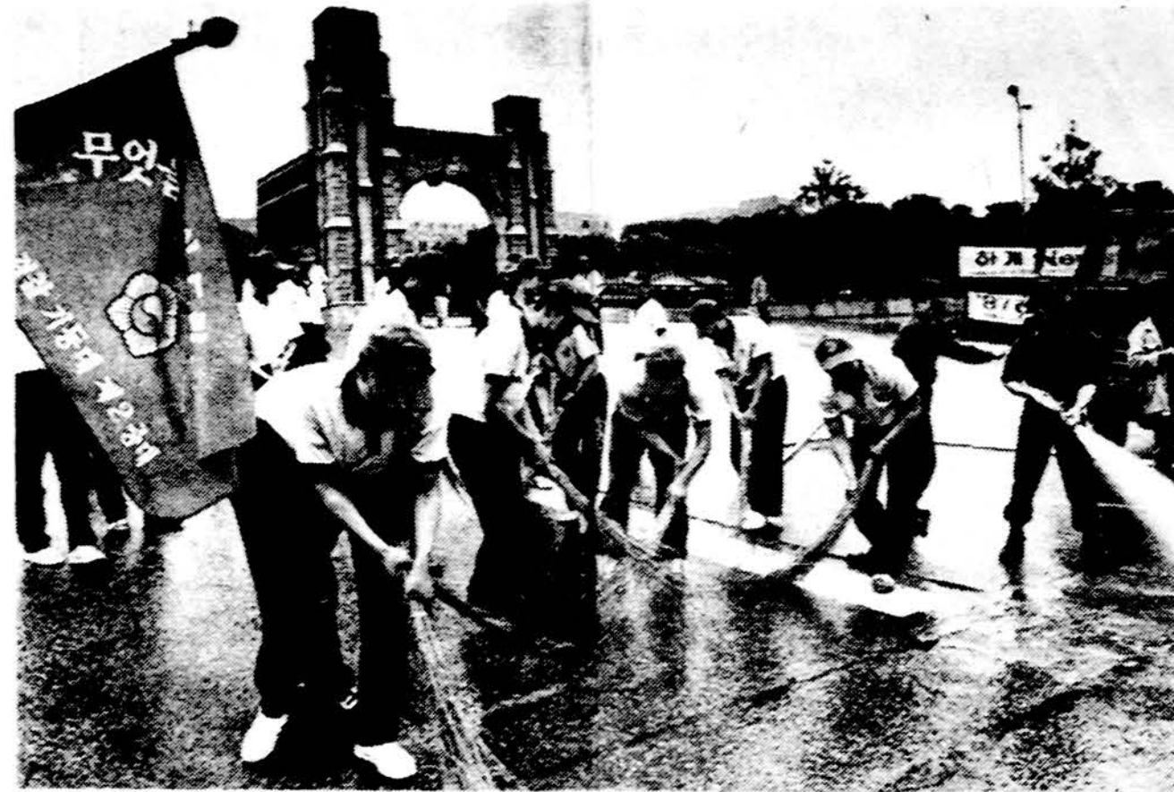
Pietų Korėjoje, prezidentui Čun priėmus demokratines santvarkos reikalavimus, anksčiau kitaip uniformuoti riaušių kontroles milicininkai šluoja ir plauna Korėjos universiteto aikštę, kurioje vyko susikirtimai tarp policijos ir studentų demonstracijų metu.