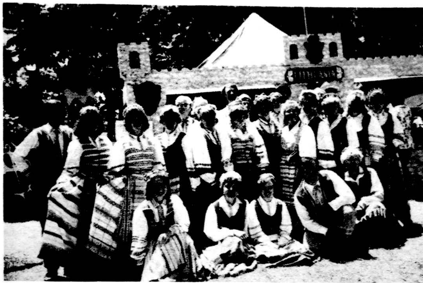
Kansas City lietuvių tautinių šokių grupė „Aidas“ atlikę programą tarptautiniame festivalyje birželio 13-14 dienomis.