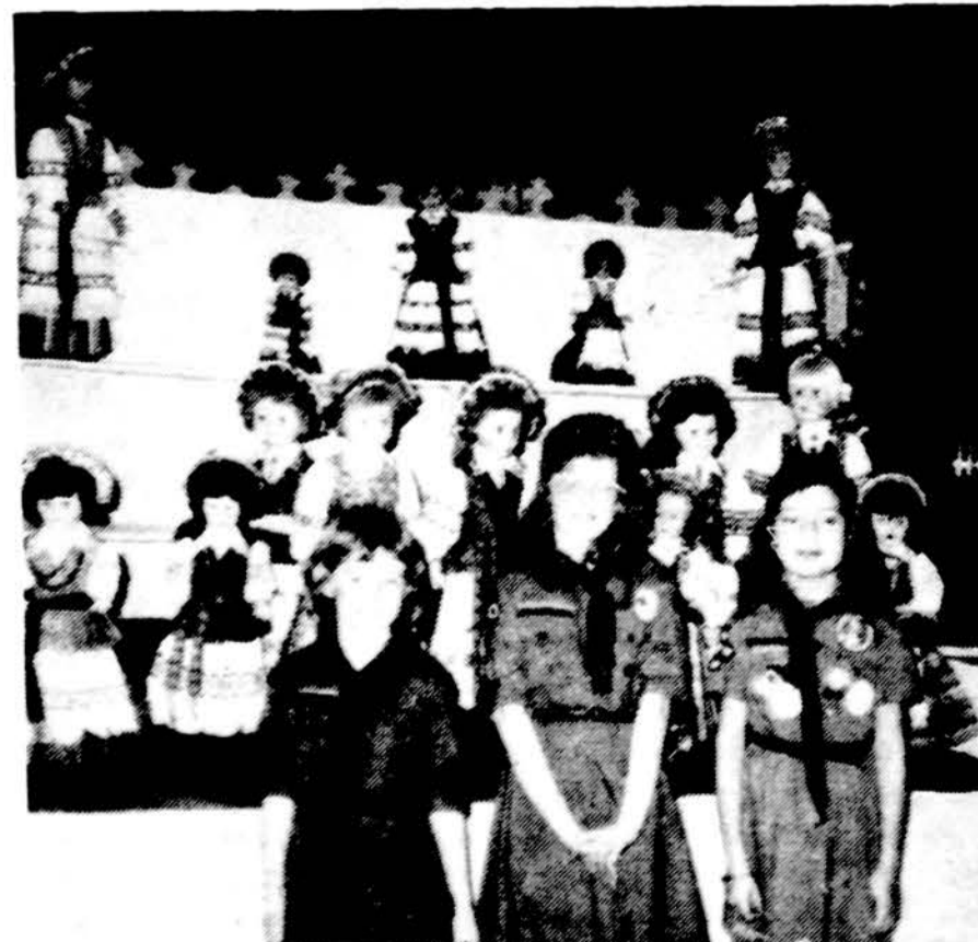
Dailios „Gabijos“ tunto sesės ir jų parduodamos lėšas Detroito Kaziuko mugėje.