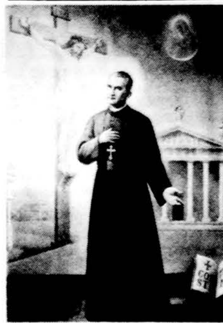
Palaimintojo Jurgio Matulaičio atidengtas paveikslas Šv. Petro bazilikoje iškilmių metu. Fone — kruzifikas, Vilniaus katedra ir virš jos — Marijos paveikslas.