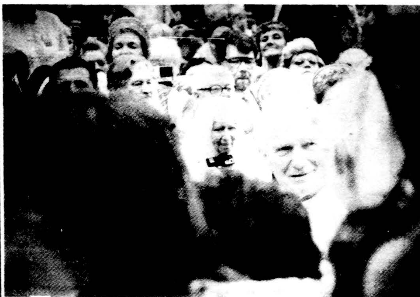
Sv. Tevas Jonas Paulius II Lietuvos krikščionybės 600 metų sukakties ir arkiv. Jurgio Matulaičio palaimintuoju paskelbimo iškilinėse apsuptas lietuvių iš viso pasaulio.