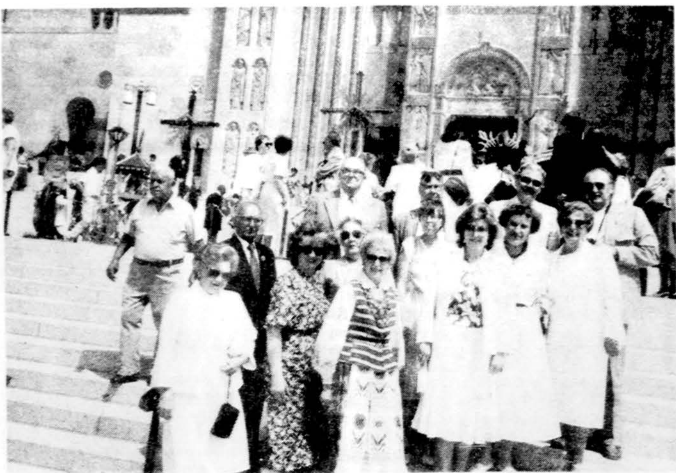
Chicago lietuviai, apsilankę Washingtone įvykusioje Lietuvos krikšto jubiliejaus iškilmėse birželio 28 d. Marijos Tautinėje bažnyčioje, kurioje matyti dalis Kryžiaus kalno.

Chicago srityje gegužės mėnesį buvo išimti 2,232 leidiniai statyti namams. Palyginus su praeitū metų gegužės mėnesiu statybos sumažėjo 18%. Visos šiemet gegužės mėn. statybos siekia 551 mil. dol. Iki liepos 11 d. Chicagoje šiemet buvo iš viso išimta leidimų statyti namus už 2.3 bil. dol.