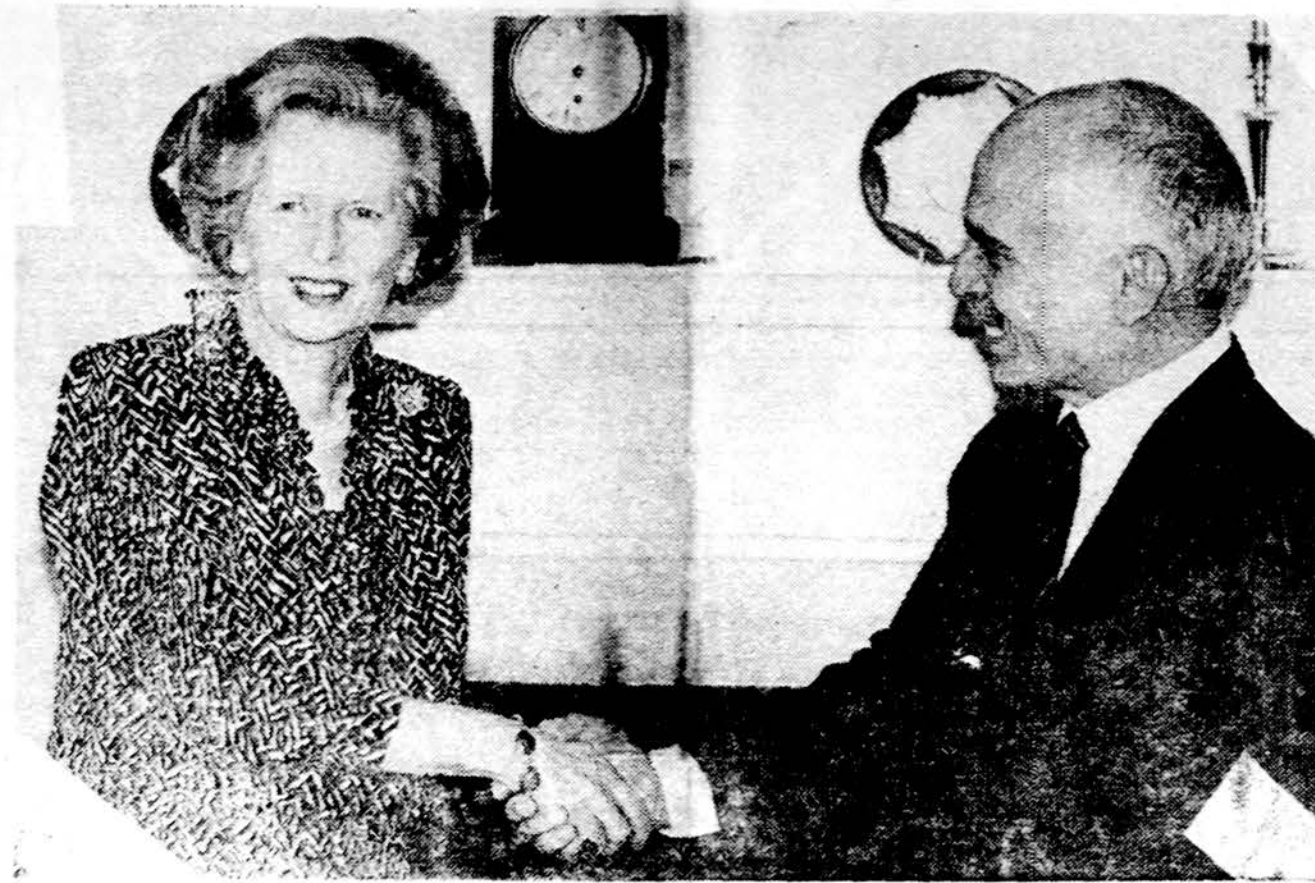
Prieš vykdama į Washingtoną, Britanijos premjerė Margaret Thatcher tarėsi su Jordano karaliumi.

Antra vertus, jie nusižengė ir pagrindinio mūsų įstatymo – Lietuvos TSR Konstitucijos 50 straipsnio reikalavimui, kuriame pasakyta: „Bažnyčia Lietuvos TSR atskirta nuo valstybės ir mokykla – nuo bažnyčios“. Mokyklos atskyrimą nuo bažnyčios, kitaip sakant, reikia suprasti kaip draudimą bažnyčiai įvairiais būdais kištis į vaikų ir jaunimo auklėjimą ir vaikus mokyti religijos dalykų. O dvasininkams – kultūrarnautams neleidiama užimti kokias nors pareigas švietimo organuose. (Bus daugiau)