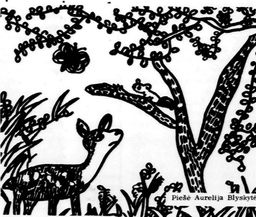
Piešė Aurelija Blyskytė

Isteigtas Lietuvių Mokytojų Sąjungos Chicago skyrius