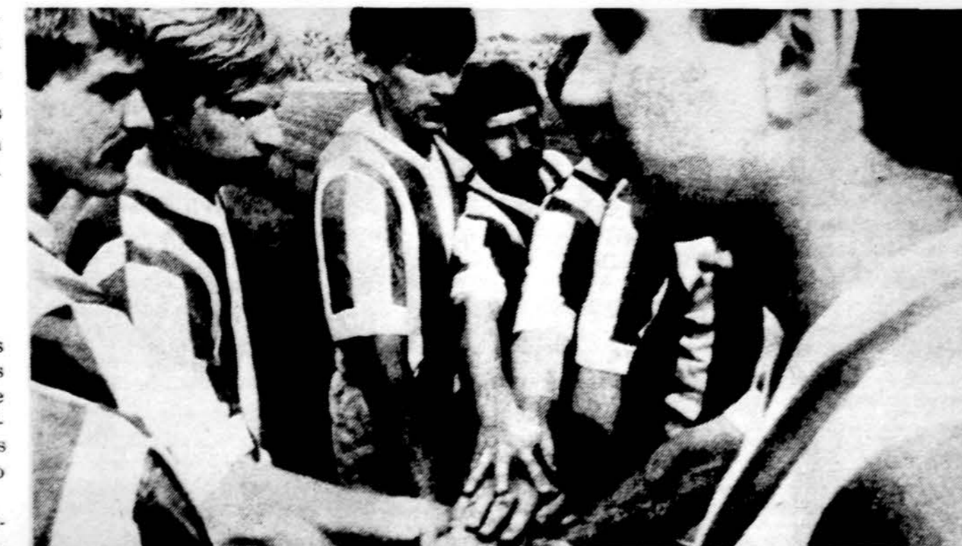
Vilniaus „Žalgirio“ vyrai futbolo aikštėje.

Čia pateikiame trumpą ištrauką iš vieno Australijos lietuvių sporto darbuotojo laiško: „Dėl išeivijos lietuvių sporto, apie tą knygą pas mus yra įvairių nuomonių. Be jokios abejonės ji yra gerai išleista ir kokybės atžvilgiu toli gražu pralenkia mūsų kuklų leidinį Lietuviai sportininkai Australijoje. Jūsų knygos kritikai pas mus nepatenkinti, kad joje nėra nieko užsiminta apie Australijos lietuvių sportą, Esą, leidejai galėjo skirti 3-4 puslapius santraukai apie mūsų sporto veiklą arba bent vienu skiniu, kur nors pabaigoje užsiminti, kad tie, kurie domisi Australijos lietuvių sportu, gali apie tai pasiskaityti mūsų išleistoje knygoje. Daug kas sako, kad nepaminėjus Australijos, jūsų knygos pavadinime žodis „išeivijos“ yra netikslus, nes juk ir mes esame tos išeivijos dalis, ar ne?“