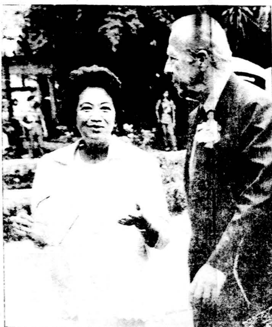
Filipinų prezidentė Corazon Aquino, paruošusi kelią demokratijai savo krašte, kalbasi su Valstybės sekretoriumi George Shultz, kuris savo švarko atlape turi išsėgęs mažytę lėlę, pavadinimą „Cory“, pagal populiarų prezidentės varda filipiniečių tarpe.

— Sidone Izraelio trupės nušovė šešis libaniečius, kurie artinosi prie šio uosto.