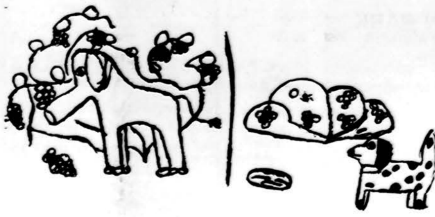
Dramblys svajoja apie vynuoges, o šuniukas žino, ką daryti su vynuogėmis. Piešė Elytė Žukauskaitė

Elytė Žukauskaitė, Dariaus Girėno lit. m-los mokinė.