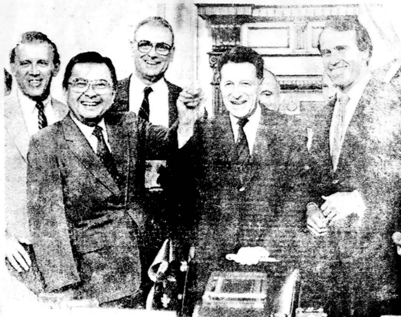
JAV Gynybos sekretorius Casper W. Weinberger, baigus viešą Irano – Contras apklausinėjimą, su kongresinio komiteto nariais. Iš kairės sen. Warren B. Rudman, sen. Daniel K. Inouye, to komiteto pirmininkas, kongr. Lee H. Hamilton ir Jim Courter.

Vakarų diplomatai sako, jog pravedimas traukinio iš Sovietų Sąjungos iki Persų įlankos įgyvendintų senas rusų svajones, nes jie galėtų transportuoti ne tik industrijos mašinas ir įrankius, bet ir karinius įrengimus.