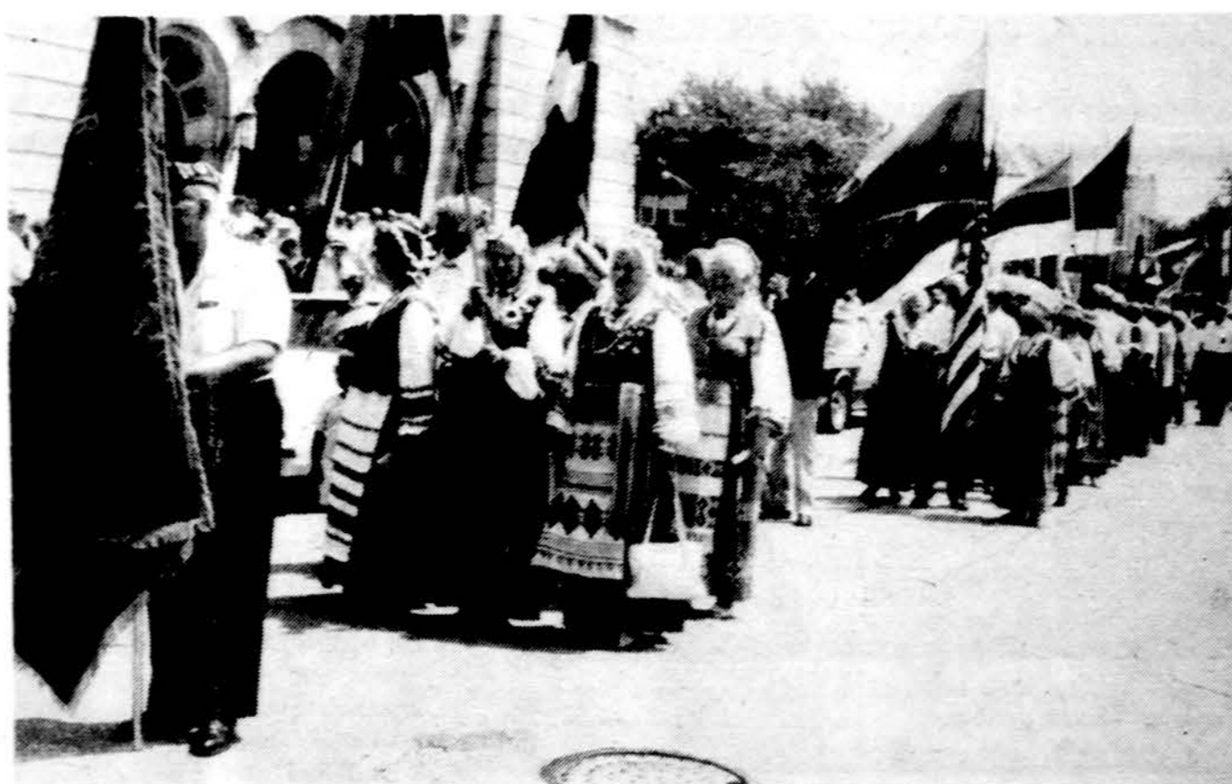
Pavergtųjų tautų savaitėje lietuvių eiseną Marquette Parke.