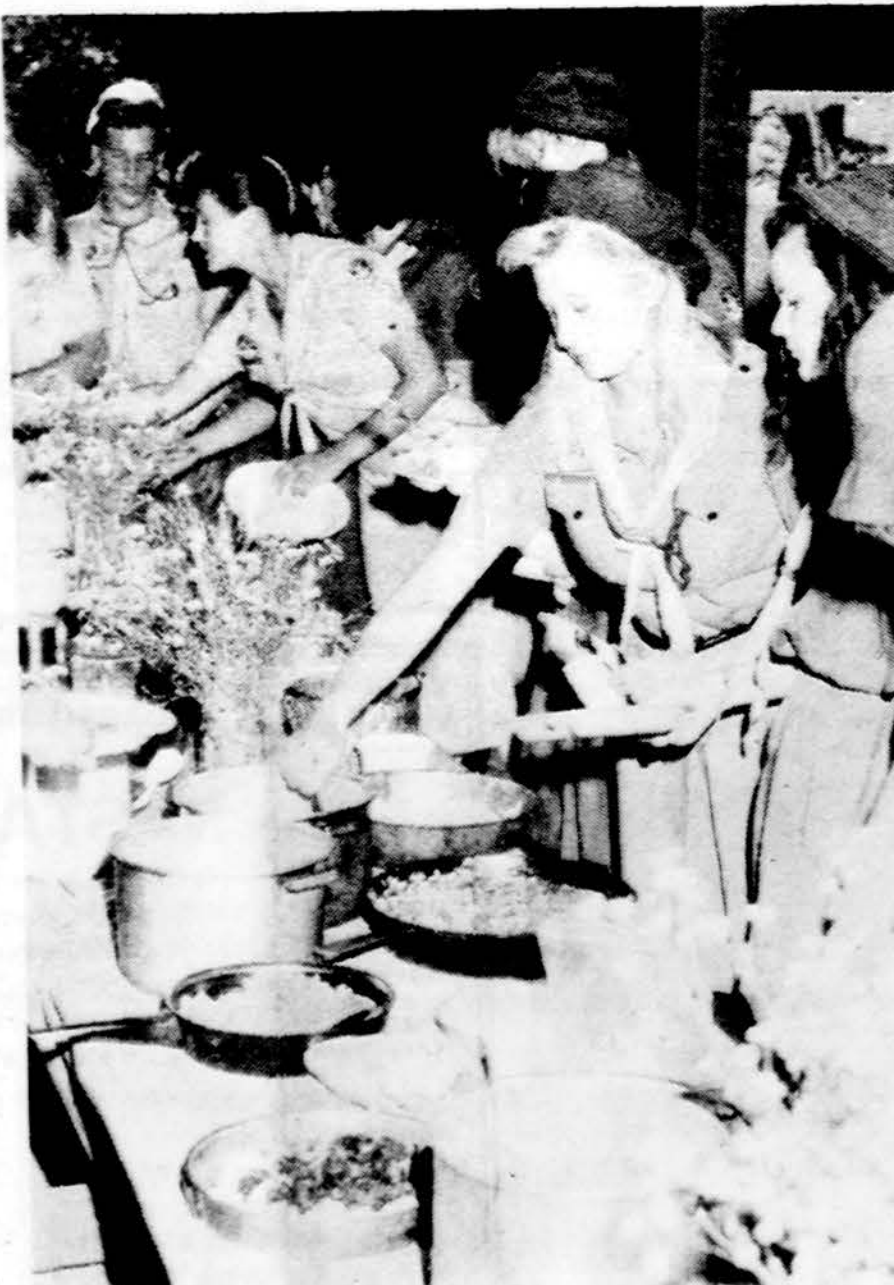
Šeiminkės, pačios skautės, skautu stovykloje.

Darbo val. nuo 9 iki 7 val. vak. Šeštad. 9 v. r. iki 1 val. d.