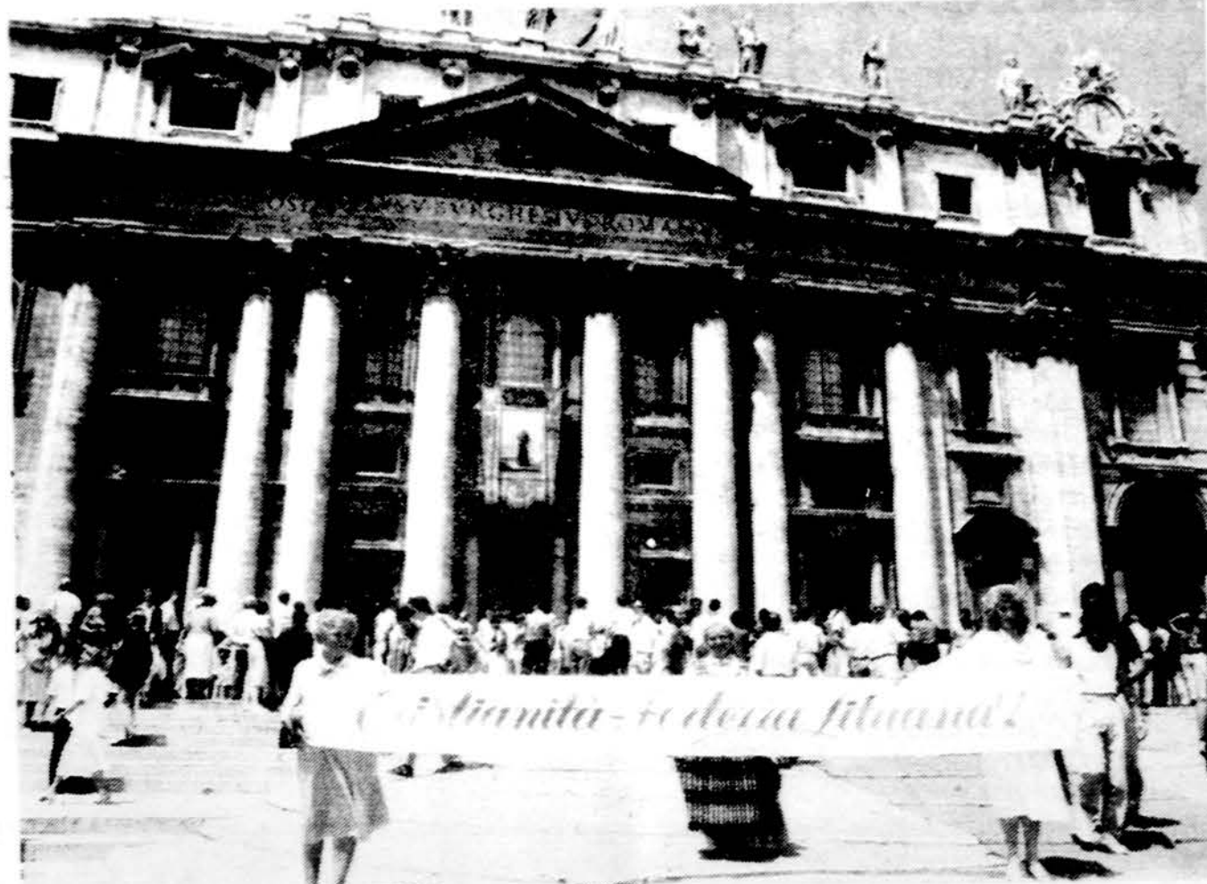
Po Lietuvos krikšto jubiliejus ir arkiv. Jurgio Matulaičio palaimintuoju paskelbimo iškilmiu lietuves moterys šeiina is Sv. Petro bazilikos su plakatu, kuris skelbia, kad „Lietuva – krikščionybės tvirtovė“.