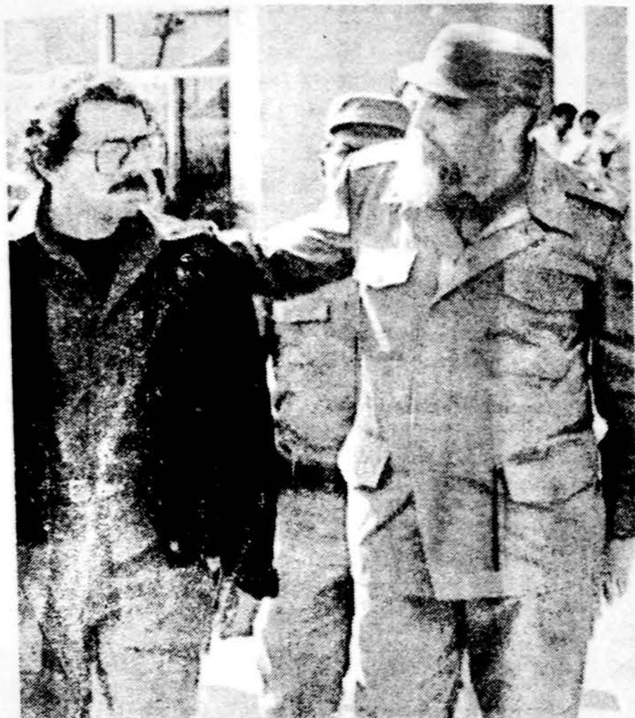
Nikaragvos sandinistų marksistinės vyriausybės prezidentas Daniel Ortega, kairėje, atvykęs pas Kubos komunistų prezidentą Fidel Castro painformuoti jį apie naująjį taikos planą ir pasiklausti tolimesnių instrukcijų.

- Washingtono Pentagonas pasirašė kontraktą su Zenith korporacija 105 mil. dol. vertės, kuri aprūpins kariuomenę kompiuteriais. Tai didelis akibrokštis japonų Toshiba firmai, kuri norėjo gauti šį kontraktą. Prieš kiek laiko Toshiba korporacija pardavė Sovietų Sąjungai povandeninių laivų technologinius kompiuterius, kurie buvo uždrausti sovietams parduoti.