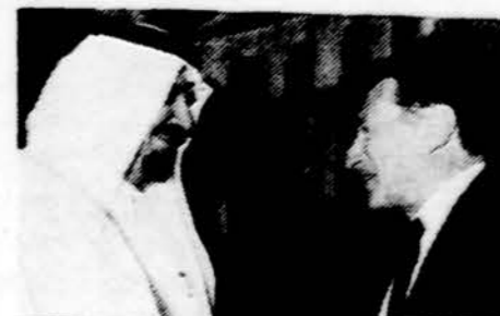
Saudi Arabijos Gynbos ministeris princas Sultan kalbasi su JAV Gynbos sekretoriumi Casper Weinbergeriu ka tik įvykusiame jų pasitarime.

Birželio mėnesį, kai buvo pultas Amerikos laivas, Saudi Arabija atsakė su savo F-15 kovos lėktuvais pulti Irako lėktuvą ir tai Kongrese sukėlė nepalankias nuotaikas prieš Saudis karalių Fahd.