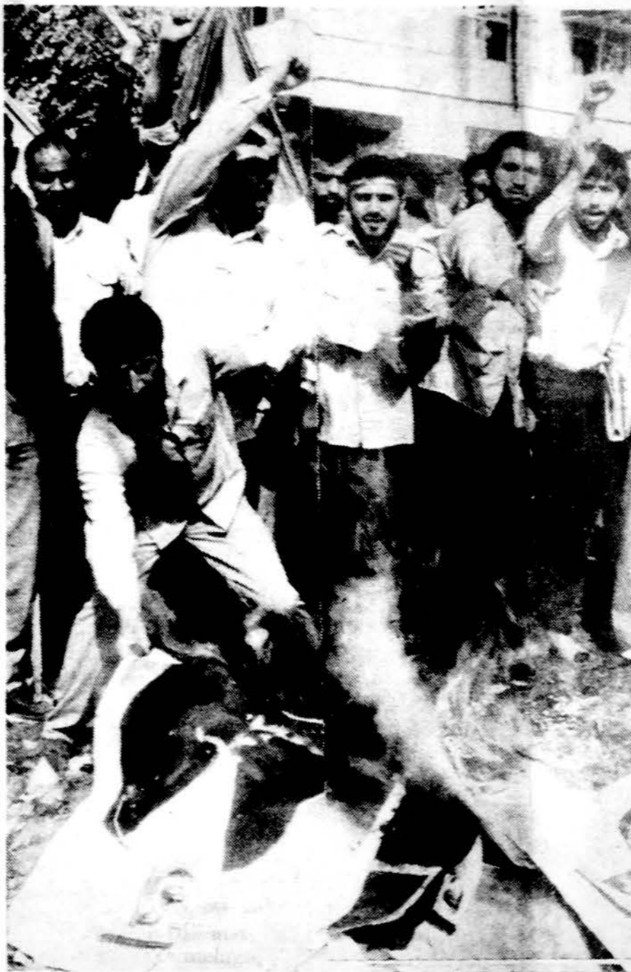
Saudi Arabijos karaliaus Fahd atvaizdas deginamas šių iraniečių prie Saudis ambasados Teherane. Nežiūrint Irano puolimui, Saudi Arabija ir toliau nusistatėsi palaikyti draugiškus ryšius su Amerika.

— Santiago mieste Čilės vyskupai paragino vyriausybę praveisti naujus ir laisvus rinkimus.