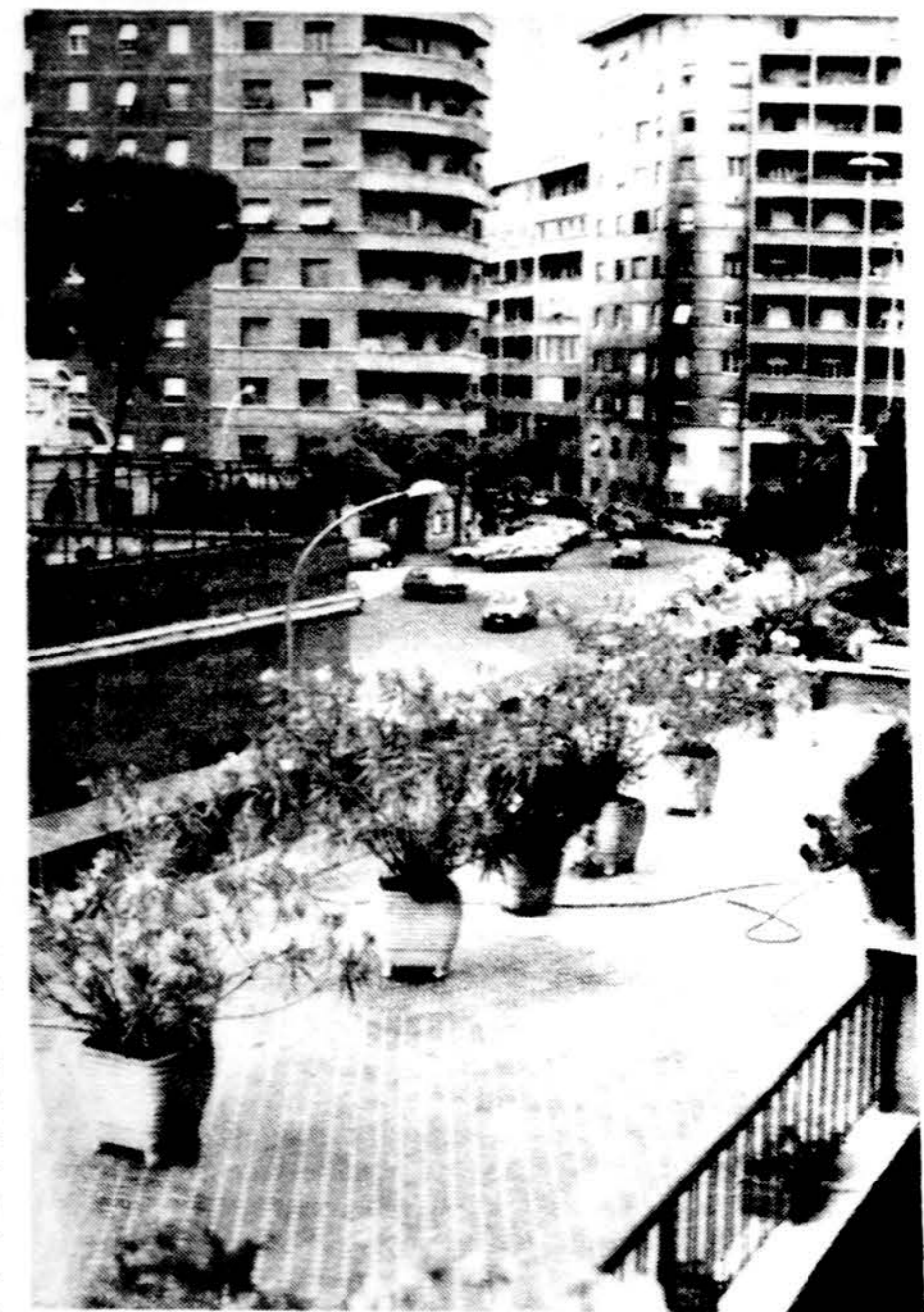
Pro Villa Lituania viešbučio langa žiūrint Romos vaizdas.

Likusio laiko metu apžiūrėjame kitas muziejaus dalis. Po pietų iškeliaujame į Šv. Petro baziliką, Apie šią, kaip ir muziejų, atskirus straipsnius galima parašyti. Ji buvo pradėta Konstantino D. laikais pagerbti šv. Petro kapą. 326 m. ją pašventino popiežius Silvestras, tačiau dabartinis pastatas išaugo viduramžių laikais. Popiežius Julius II pakvietė architektą Bramantę, kuris padarė planą ne pagal tradicinį lotynų kryžių, bet pagal graikų. Tuomet Michelangelas dar buvęs jaunas ir stebėjęs Bramantę dirbant. Vėliau, kai bazilikos sta-