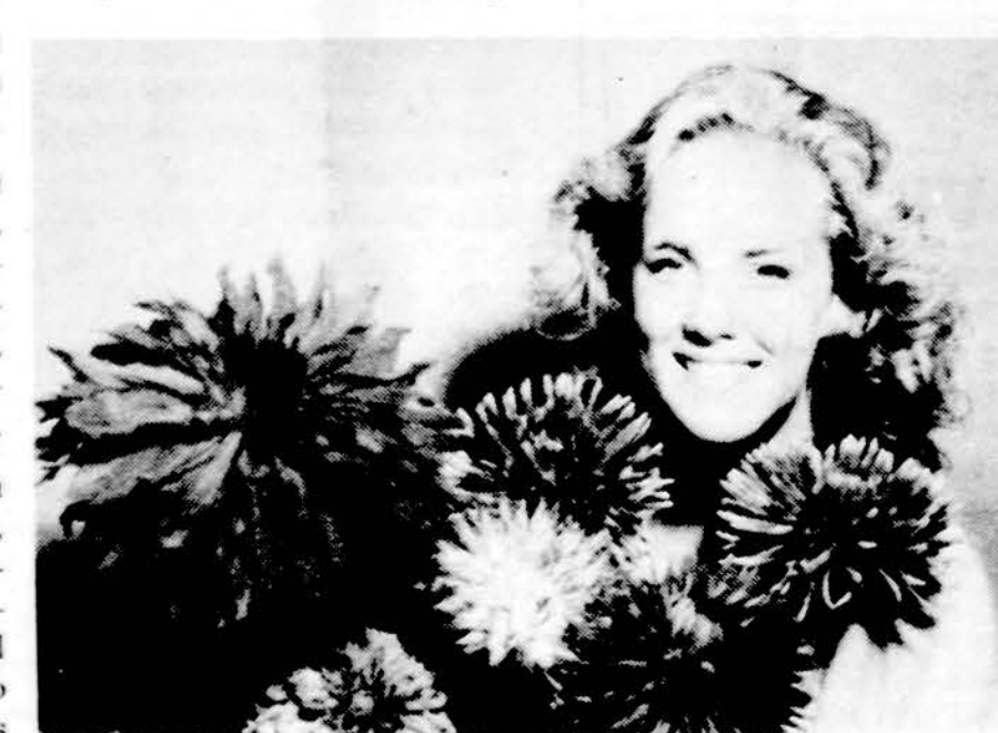
Jurginų parodos urogaite, kuri reklamoja jurginų. Paroda bus Hilton Inn, Oak Lawn, Ill., rugsėjo 5 ir 6 dienomis.