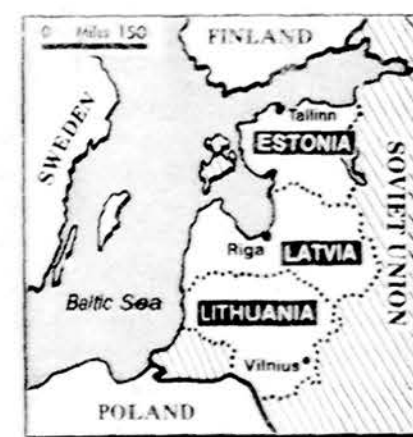
Šis ir panašūs kiti mazi žemėlapiai buvo patalpinti didžiojoje pasaulio spaudoje pirmuose puslapiuose prie aprašymų apie Pabaltijo tautų demonstracijas, o ypač Vilniuje rugpjūčio 23 d.

„Jei tai nėra kišimasis į kitos valstybės vidinį gyvenimą, tai kas pagaliau yra?“, klausia