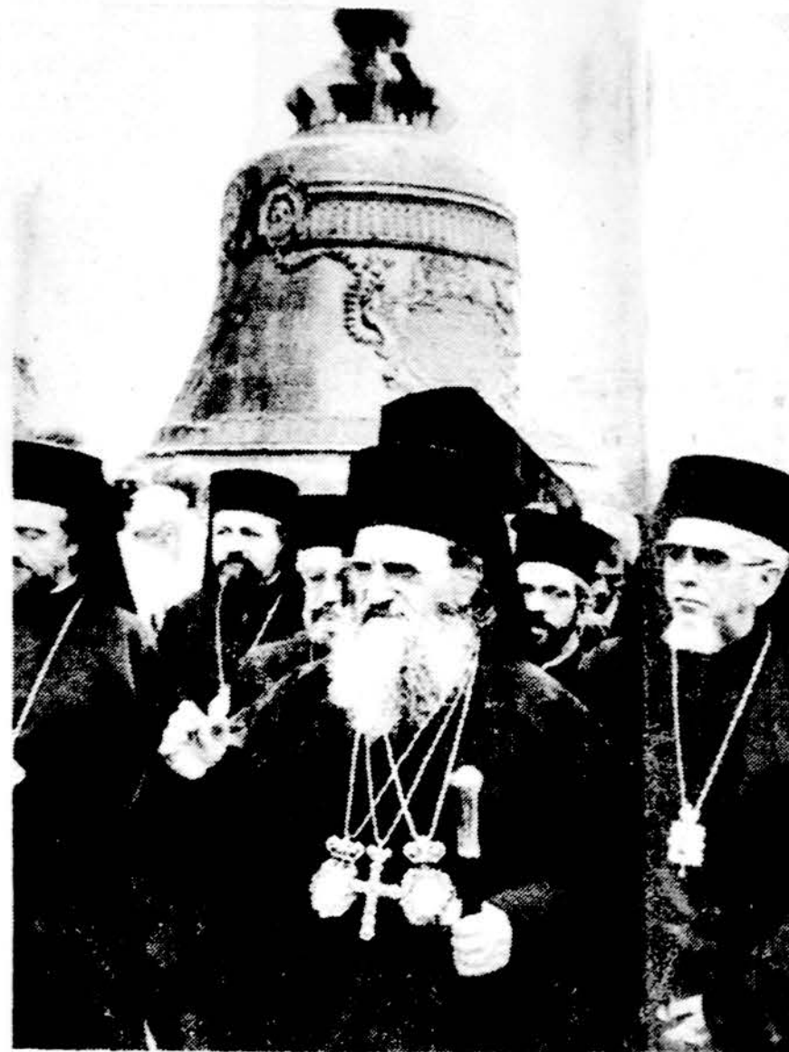
Rytų Ortodoksų Bažnyčios vadai Maskvoje. Patriarchas Dimitrios, centre, iš Istanbulio, atvyko į Kremlių. Jis Sovietų Sąjungoje išbuo 12 dienų. Beveik 400 metų, kai nebuvo Rytų Ortodoksų vizito Rusijoje.

- Chicagoje praėjusį savaitgalį neįvyko Grant Parko vasaros koncertai kadangi sustreikavo choras, nes nepavyko susitarti dėl naujo dainavimo kontrakto. Unija, reikalavo didesnio atlyginimo. choristai dabar gauna nuo 9.20 dol. iki 14.45 dol. per valandą už repeticijas ir už kiekvieną koncertą po 75 dol.