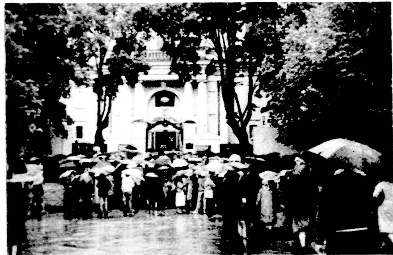
Prie Šv. Onos bažnyčios žmonės, minint Lietuvos krikšto 600 metų sukaktį, birželio 28 d.