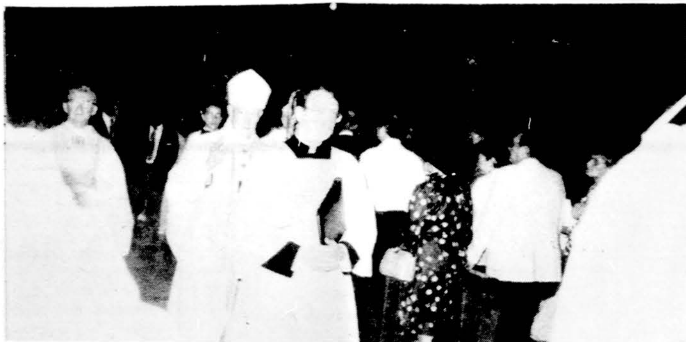
Procesija su vysk. Hickey Washington, minint Lietuvos krikščionybės 600 metų sukaktį.