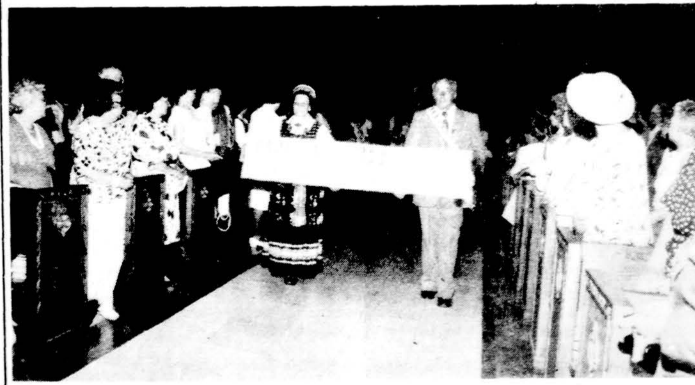
Newarke, N.J., minint Lietuvos krikšto 600 metų sukaktį nesamas Šv. Trejybės parapijos plakatas.

Japonai šluotomis niokoja cukrinių runkelių filiusus, prieš perkeldami juos iš šiltnamių į laukus. Moksliniai tyrimėjimai JAV-ese, Britanijoje ir Japonijoje rodo, kad toks darbinis atveju su dideliais finansiniais nuostoliais. Mums tai būtų didelis, neapskaičiuojamas moralinis smūgis. Atmetus pardavimo galimybę, belieka susijungimo galimybė. Keliems laikraščiams susijungus, naujas leidinys, kad ir be šviežio kraujo įleidimo, galėtų tapti didesne, įvairesne, įdomesne lie-