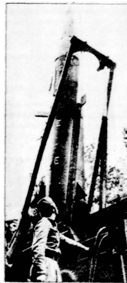
Vokietijos Pershing 1-A raketa

Savo pranešime kancleris pasakė, jog tos raketos niekad negalėjo būti Genevos pasitarimų objektu, nes nepriklauso Amerikai ar Sovietams ir Kohl kaltino Sovietų Sąjungą, kad iš viso tokį klausimą galėjo kelti Genevoje. Bet Vokietija, kai yra lemiamas momentas, nenori būti kliūtimi. „Aš noriu padėti Amerikos prezidentui laimingai pabaigti Genevos nusiginklavimo pasitarimus“, „Jei dvi didžiosios galybės gali pasiekti susitarimo minimumą raketų atveju, ir jei susitarimas bus ratifikuotas ir įsigalios“, pasakė kancleris Kohl „aš galiu deklaruoti šiandien, jog su paskutiniu Amerikos ir Sovietų Sąjungos vidutinio nuotolio raketų išardymu, Pershing raketos nebus modernizuojamos, bet sunaikinamos“.