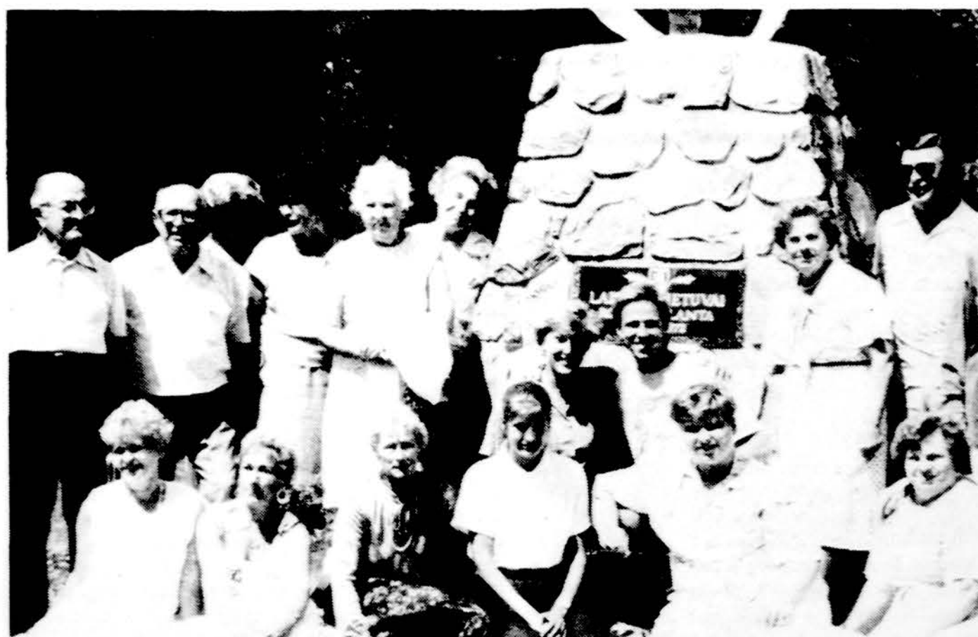
Dalis mokytojų Dainavoje rugpjūčio 20 d įvykusioje Mokytojų studijų savaitėje.