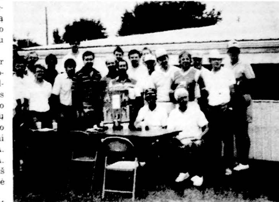
Golfininkai po Clevelando ir Detroito Lietuvių Golfo klubų metų tarpmiestinių žaidynių.