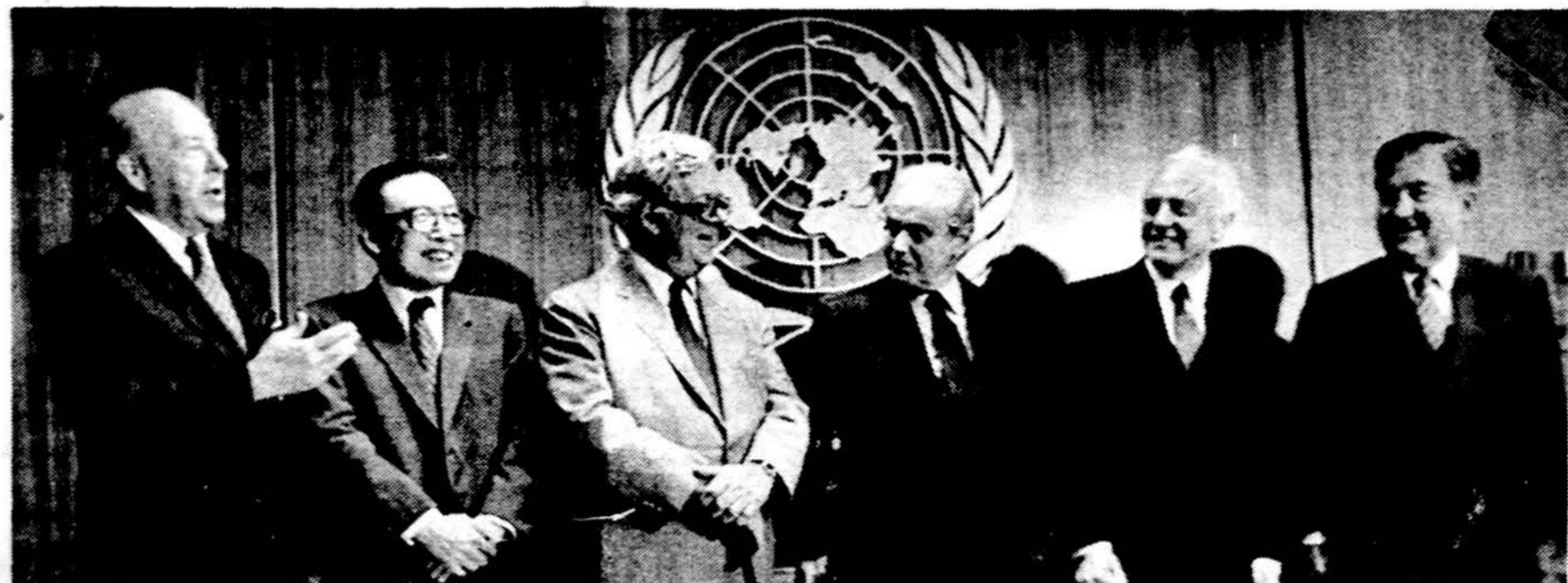
Valstybės sekretorius George Shultzas, kairėje, su Jungtinių Tautų Saugumo Tarybos nariais po pasitarimų Irano-Irako karo paliaubų reikalui. Iš dešinės matyti Prancūzijos užsienio reikalų ministras Jean-Bernard Raimond, Sovietų Sąjungos užsienio reikalų ministras Eduard