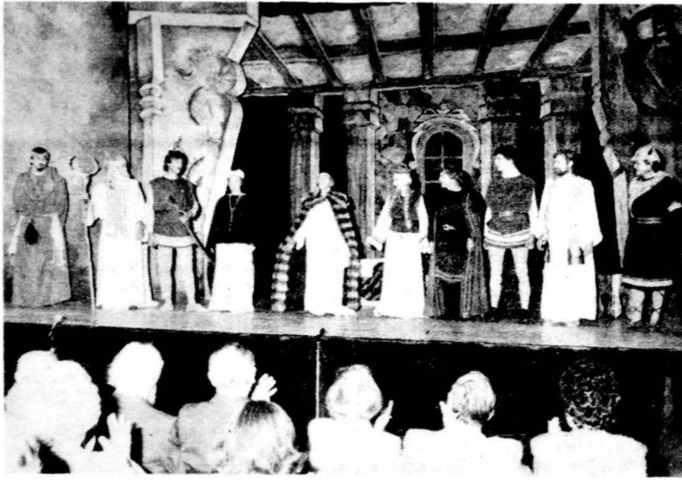
Los Angeles Dramos sambūris po sėkmingo Putino „Valdovo“ pastatymo.