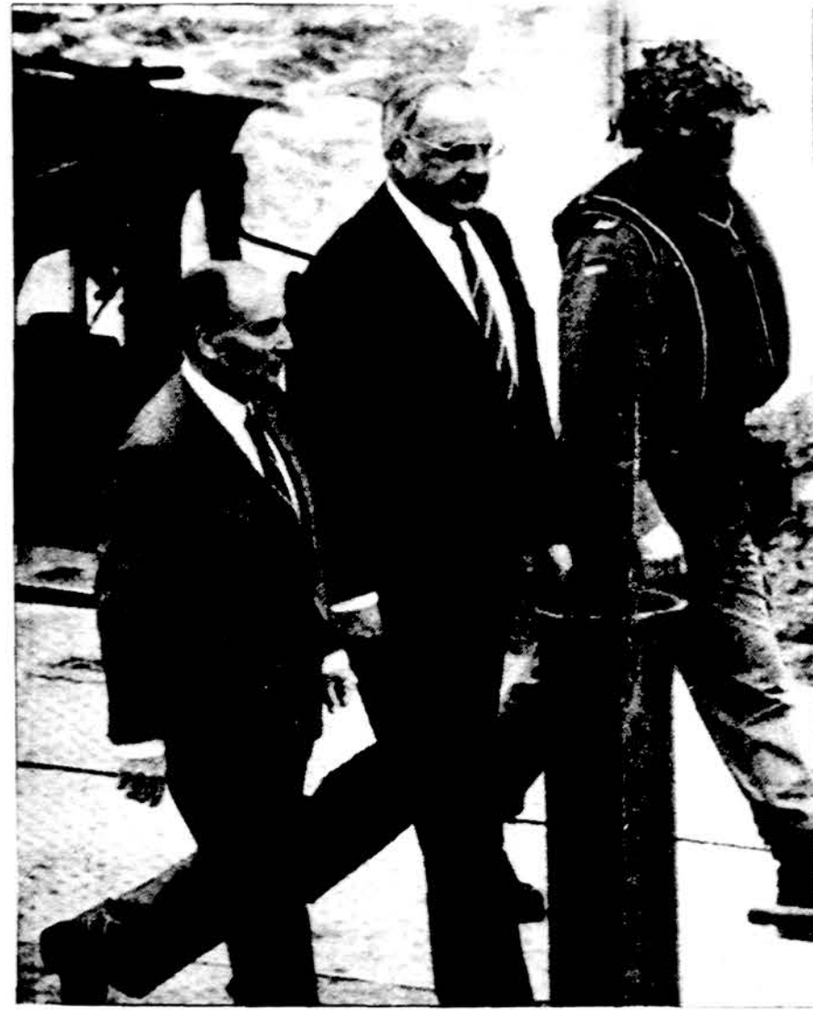
Vadai žengia per naują tiltą. Lydimi Vakarų Vokietijos karo inžinieriaus, dešinėje, per specialiai pagamintą pantomininį tiltą per Dunojus upę žengia Prancūzijos prezidentas François Mitterand, kairėje, ir Vakarų Vokietijos kancleris Helmut Kohl, kai jie kartu vizitavo karinius manevrus Bavarijoje.