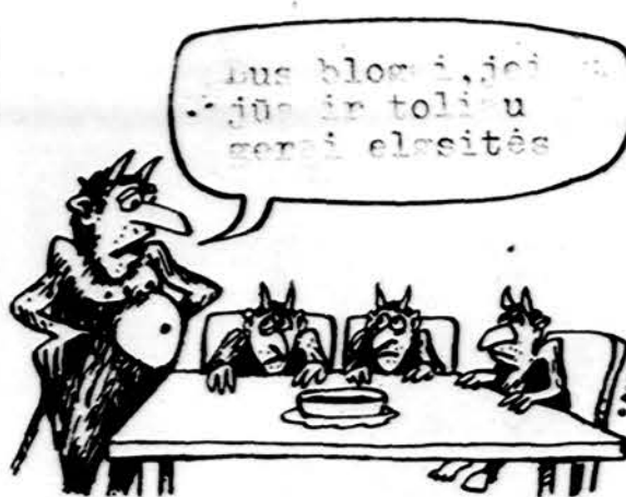
Iš vokiečių spaudos

Londono lenkų dienraštis Dziennik Polski išdėjo vieno lenko turistų išpūdžius iš apsilankymo Vilniuje. Miestas ir „Lietuvos“ viešbutis jam labai patiko, tvarka gera, tik turis vieną priekiaistą viešbučių: „Viešbutis priima visus lenkų turistus, ekskursijas, tik, deja, Lenkijos Liaudies respublikos moterys, apsisitėjusios tame viešbuty, užsiima seniausia profesija, ir tai kenkia geram viešbučio vardui. Turistus iš Lenkijos patartina laikyti atskiruose viešbutuose. Taip yra daroma Budapešte ir kituose Rytų Europos miestuose“.