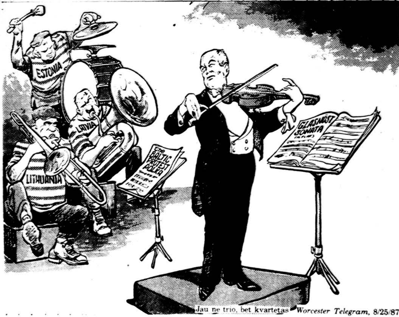
Jau ne trio, bet kvartetas Worcester Telegram, 8/25/87

„Dirbu Vilniaus rajono centrinėje ligoninėje gydytoja. Pagal iškvietimus bet kuriuo paros metu tenka važiuoti į Bezdonių. Gyvenvietė nemaža, jau per tūkstantį gyventojų, o gatvės — be pavadinimų, naujų namų virtinės, butai — be numerių. Orientyras — „už parduotuvės“, „prie mokyklos“.