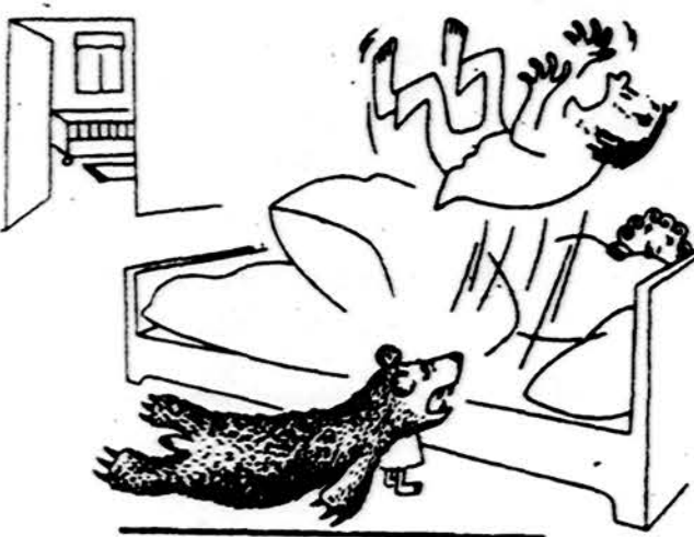
Iš užsienio spaudos