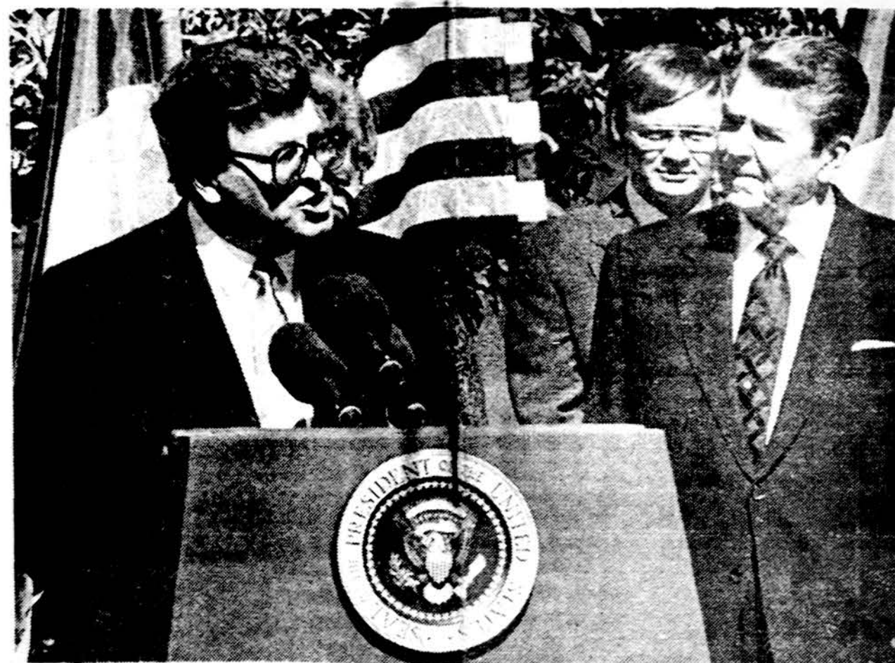
Vakarų Vokietijos Bundestag pirmininkas Philipp Jenninger su prezidentu Ronald Reagan Baltųjų rūmų sode, kai spalio 6 diena buvo paskelbta vokiečių-amerikiečių diena. Tai jau ketvirtoji sukaktis, kai buvo pradėta Kongreso - Bundestago universiteto studentų pasikeitimo programa. Amerikoje studijuoja 11,000 vokiečių studentų. Vak. Vokietija, būdama dėkinga po karo už Marshallo planą, kasmet dovanuoja 10 milijonų vokiečių markių Amerikos Vokiečių Marshallo fondui Amerikoje.