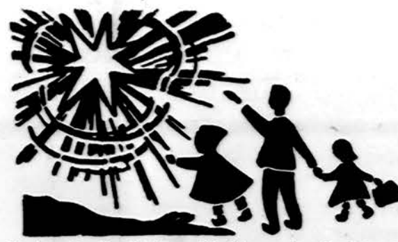
Redaguoja J. Placās. Medžiagą siųsti: 3206 W. 65th Place, Chicago, IL 60629