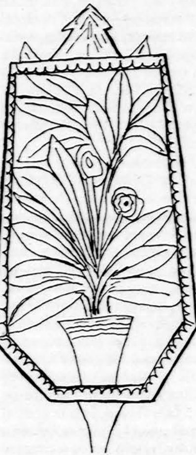
Verpstė Piešė Laima

Pirmajame pasauliniame kare. Tie lėktuvai neturėjo automatiškų šautuvų. Pilotas turėjo paleisti vairą, kad galėtų šauti.