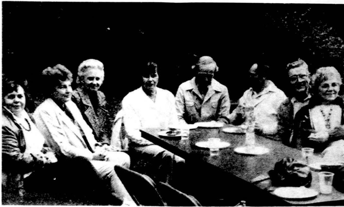
Grupė ALIAS gegužinės dalyvių.

x Antras kaimas šį sezoną pasirodo šeštad., spalio 10, 17 ir 24 (8 v.v.) ir sekmad. spalio 11 ir 18 (6 v.v.) Playhouse, 2515 W. 69 St. Siekiant patogumo žiūrovams vietų skaičius ketvirtadaliu sumažintas, todėl praversti staliukus rezervuoti ankčiau 471-1424. (sk.)