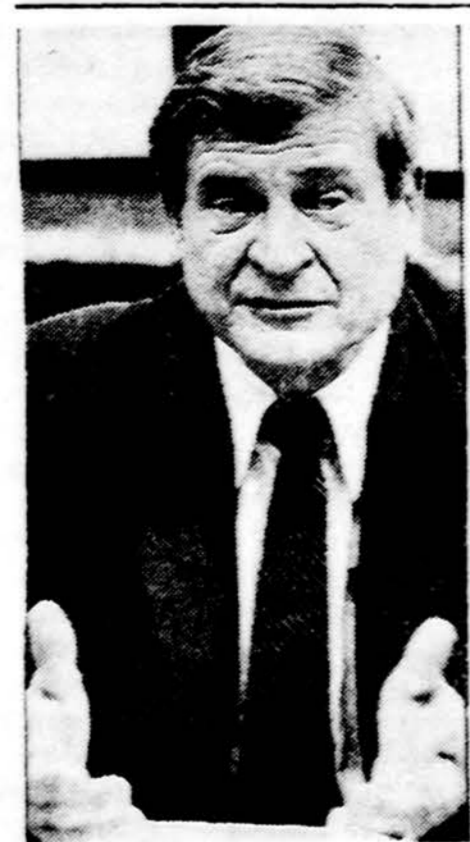
Kongresmenas Dan Rostenkowski, demokratas iš Illinois valstijos, pasakė, jog demokratai pradėjo ruošti specialiu mokesčių įstatymą, nežiūrint, kad respublikonai atsiskaitė dalyvauti. Tas įstatymo projektas turi būti baigtas iki spalio 15 d. Trūksta 12 milijonų dolerių, kuriuos demokratai nori surinkti nauju mokesčių forma.

Saulė teka 6:53, leidžiasi 6:23. Temperatūra dieną 53 l., naktį 30 l.