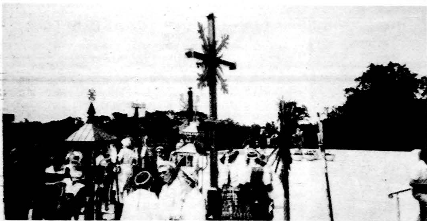
Kryžiai iš Baltimorės Washingtono Lietuvos krikščionybės sukakties minėjime.