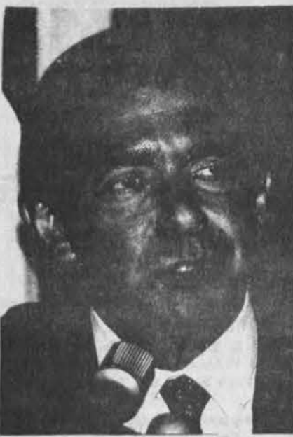
Costa Ricos prezidentas Oscar Arias Sanchez, šiuo metu Nobelio Taikos premijos laureatas.

Saulė teka 7:02, leidžiasi 6:10. Temperatūra dieną 68 l., naktį 50 l.