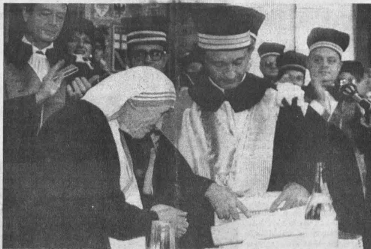
Nobelio Taikos premijos laureatė vienuolė Motina Teresė priima garbės doktoratą, kurį jai suteikė Bolognijos universitetas Italijoje. Šis universitetas mini 900 metų sukaktį.

Washingtonas. — Ginkluotųjų pajėgų kariai galės kariuomenėje nešioti jarmulkas, turbanus ir kitus religinius ženklus, kaip patvirtino praėjusią savaitę Senatas. Bet tie nešiojami ženklai turės būti labai svarūs ir netrukdyti kariškoms pareigoms. Už šį pasiūlymą balsavo 55 senatoriai, prieš 42. Perna šis projektas buvo atmetamas dviem balsais. Atstovų rūmai taip pat turi tokį pat pasiūlymą balsuoti šią savaitę. Reagano administracija pasisakė prieš tokį pasiūlymą. Sen.