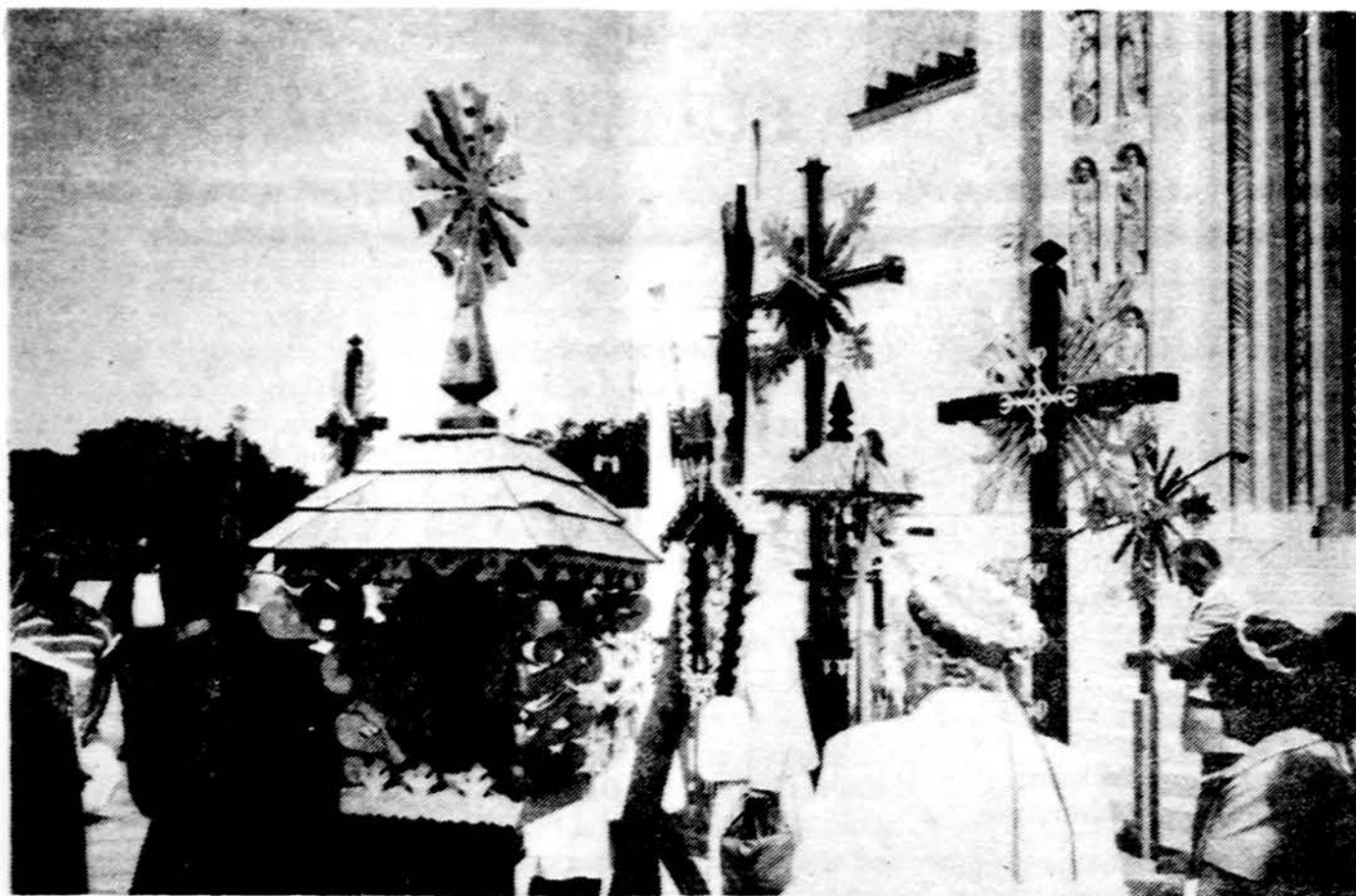
„Judodo kaspino“ demonstracijose rugpjūčio 23 d. Chicagoje prie Washingtono paminklo dalis dalyvių.

Taigi pažiūrų ir įsitikinimų visai negalima uždrausti. Klaidingos pažiūros įveikiamos ne draudimais, bet argumentais. Tik prieš nemoralius poelgius jau reikalingi draudimai ir baudmės.