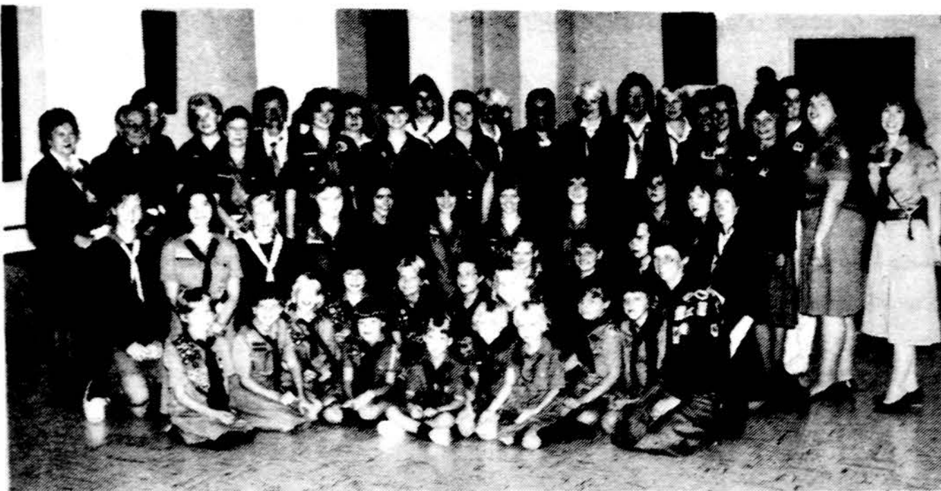
„Kernavės“ tunto šeimos portretas – tuntininkių pasikeitimo sueigoje dalyvavusios kernavietės.

Gausiu plojimu sutikta prelegentė paaiškino, kad šio vakaro pašnekesys tai ištrauka iš platesnio rašinio, kuris su kitų autorių straipsniais netrukus pasirodys knyga (redaguota V. Vardžio), skirta Lietuvos krikšto sukakčiai. O šio vakaro tema – „Lietuvos religinė diploma-