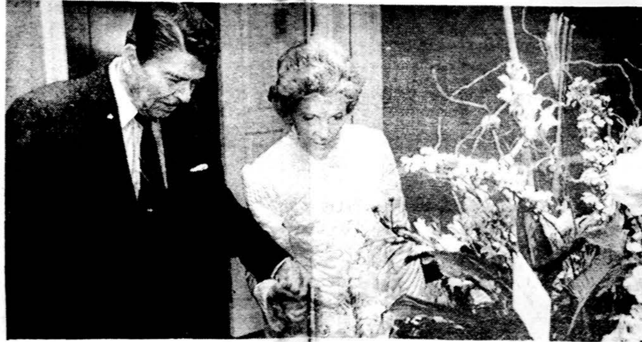
Prezidentas Ronald Reaganas, lankydamas savo žmoną Nancy Bethesda laivyno ligoninėje, kurioje jai buvo padaryta vežio operacija, kartu su ja apžiūri jai atsiustas geles.

Eina nuo 1972 metų. Perskaitęs duok kitam! Jei gali, padaugink!