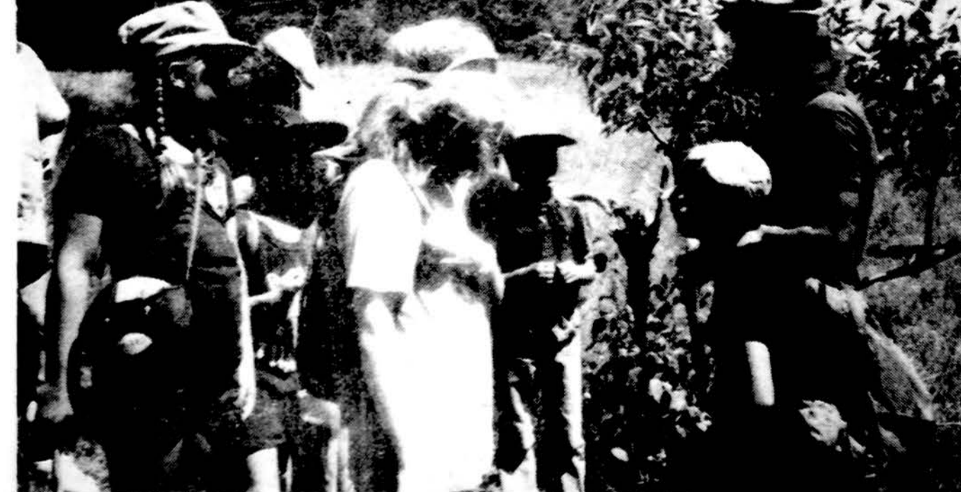
Detroito jaunesnieji skautai „Nemuno“ stovykloje susipažįsta su augmenija.