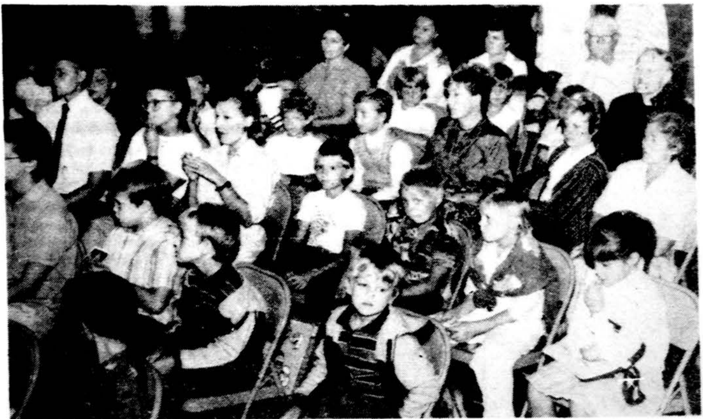
Pirmoji naujų mokslo metų diena Clevelando Šv. Kazimiero liuanistinėje mokykloje. Mokiniai ir mokytojai klausosi mokyklos vedėjo R. Apanavičiaus kalbos.