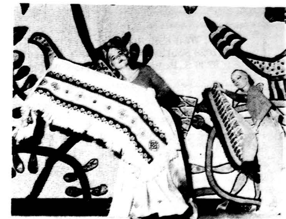
Violetos Karosaitės studijos šokėjos šoka skaru šoki per 26-tąją madų parodą.

9525 So. 79th Avenue, 4A Hickory Hills, IL 60457 312-598-1333