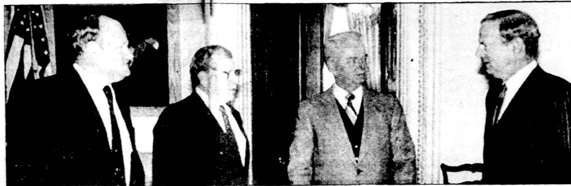
Vyriausieji Baltųjų rūmų viršininkai atvyko į Kapitolių tartis JAV biudžeto klausimais. Iš kairės matyti Biudžeto direktorius James Miller, Baltųjų rūmų štabo viršininkas Howard Baker, Senato daugumos vadas Robert Byrd ir Izdo sekretorius James Baker.

— Washingtono Baltuosiuose rūmuose prezidentas priėmė Ugandos prezidentą, kuris paprašė finansinių kreditų, kad galėtų padėti kraštui išbristi iš ekonominio sunkumo.