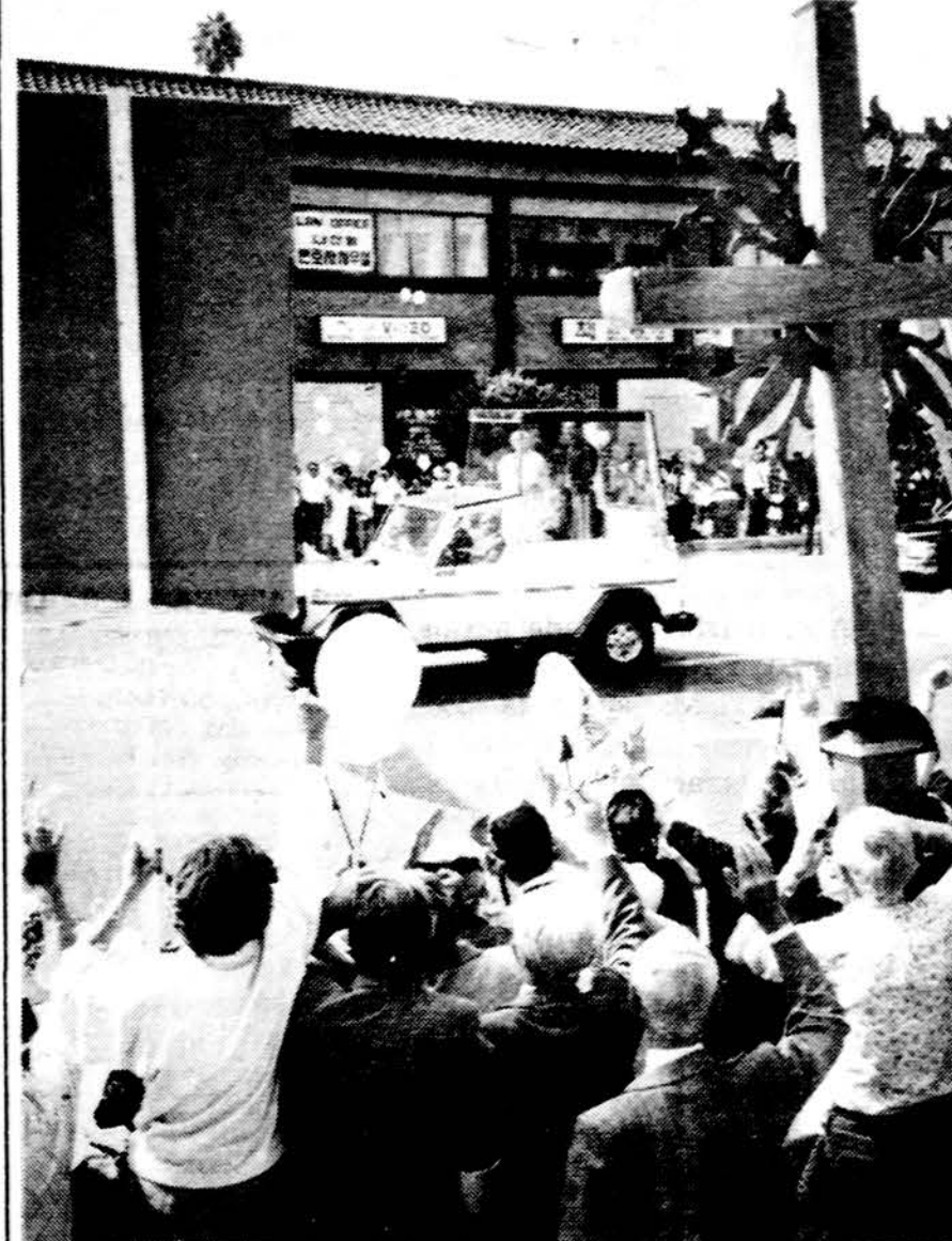
Los Angeles lietuviai rugsėjo 15 d. sveikina iš tolo Sv. Tėva Joną Paulių II atvažiuojanti gatve.

Europos futbolo gyvenime įvyko keletas staigmenų. Klasifikacinėse rungtynėse Europos pirmenybėms Svedija savo sostinėje pralaimėjo Portugalijai 0:1. Skandinavai pateko į sunkumų 1988 m. Vakarų Vokietijoje įvykstančioms pirmenybėms. Trečioje grupėje favoritas yra Sov. Sąjunga, penktoje – Graikija ar Olandija ir septintoje Bulgarija, kuri Sofijoje įveikė Belgiją 2:0. Vokiečių sportinė spauda, patekusiais ir aštuntąjį laiką Italija, Anglija, Sov. Sąjunga ir Bulgarija. Savaiame