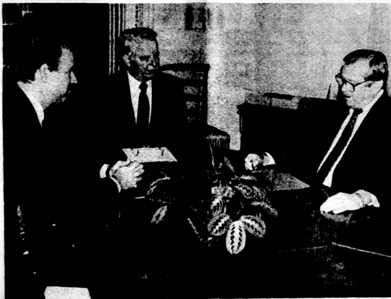
Baltųjų rūmų štabo viršininkas Howard H. Baker, dešinėje, tariai su senatoriais Robert C. Byrd, viduryje, Senato daugumos vadu, ir Joseph R. Biden, Jr., Teisės komiteto pirmininku, ką nominuoti į Vyriausiojo Teismo teisėjus, kai Robert Bork kandidatūra buvo atmesta Senate.

Respublikonai ir demokratų sutaria, kad toks įstatymas yra būtinais reikalingas. Vyksta pasitarimai Kongrese ir ieškoma būdų, kad išdard nebancrutuotų. Reagano administracija siūlo, kad Medicare mokėjimai būtų pakelti 38.5% vien tik todėl, kad gydytojų patarnavimas vyresniems kainuoja žymiai daugiau, negu praeityje. Nėra abejones, kad bus susitarta ir įstatymas atsiras ant prezidento stalo.