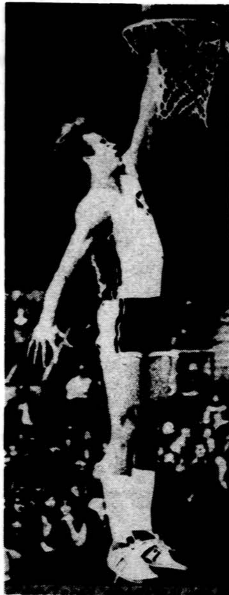
Sarūnas Marčiulionis — nauja ok. Lietuvos krepšinio žvaigždė.

Istoriniame krepšinio turnyre, kuriame pirmą kartą dalyvavo tikri profesionalai Milwaukee „Bucks“ ir (neva) mėgėjų komandos sovietų rinktinė ir Milano „Tracer“. Marčiulionio pavarde skambėjo taip dažnai, kad ją televizijos ir radijo komentatoriai ir reporteriai pradėjo visai gražiai ištarti. Profesionalų treneriai ir žaidėjai vienbalsiai sutinka, kad jis vienintelis iš sovietų komandos jau galėtų žaisti bet kurioje profesionalų komandoje, o reporteriai po turnyro išrinko „ALL STAR“ penketą, į kurį įėjo 3 Milwaukee žaidėjai, Milano McAdoo (buvęs JAV profesionalas) ir lietuvis Sarūnas Marčiulionis. Jo pavarde pasaulio krepšinyje dabar skamba, kaip A. Sabonio skambėjo praėjusiais metais.