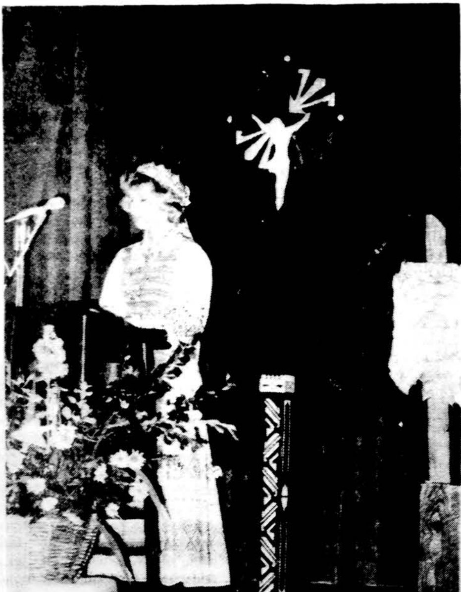
Skaitymus šv. Mišiose atlieka Washington, minint Lietuvos krikščionybės 600 metų sukaktį.

Visą šią programą apimant, bus tikrai didingas renginys, kuris ir pritinka lietuvių sostinei. Programos ruošia jau vyksta pilnu tempu, tik norėtusi paklausti, ar mes irgi jau esame numatę ir apsvarstę įnešti savo dalį, kad ši didžioji šventė kuo iškilmingiau praeitų. O tai galime padaryti visur dalyvaujant, ir ne tik religinėje dalyje bažnyčiose, bet ir koncerte, Morton aukštesniojoje mokykloje, literatūros vakare Marijos aukštesniojoje mokykloje, o taip pat gausiai aplankydami parodą „Krikščioniškoji Lietuva“ Jaunimo centre. Bilietus koncertui