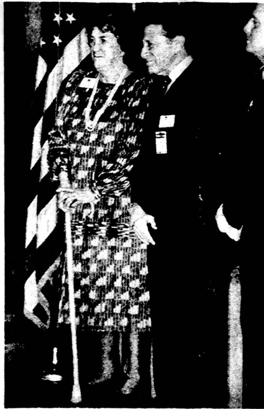
Gynbybos sekretorius Caspar W. Weinberger priėmimo vaišėse Monterey, Californijoje, su savo žmona Jane. Ji patvirtino žinią, kad jos vyras atsisakė šandien ir ji džiaugiasi, kad jis galės su ja būti visą laiką.

Jo šeimos nariai papasakojo, kad jis neseniai prarado darbą ir paskutiniu metu buvo labai nepastovus. Jis sakėsi nepasitikintis politikieriais ir noris juos iššaudyti. Laikomas be užstato ir jam bus psichiatro patikrinta sveikata.