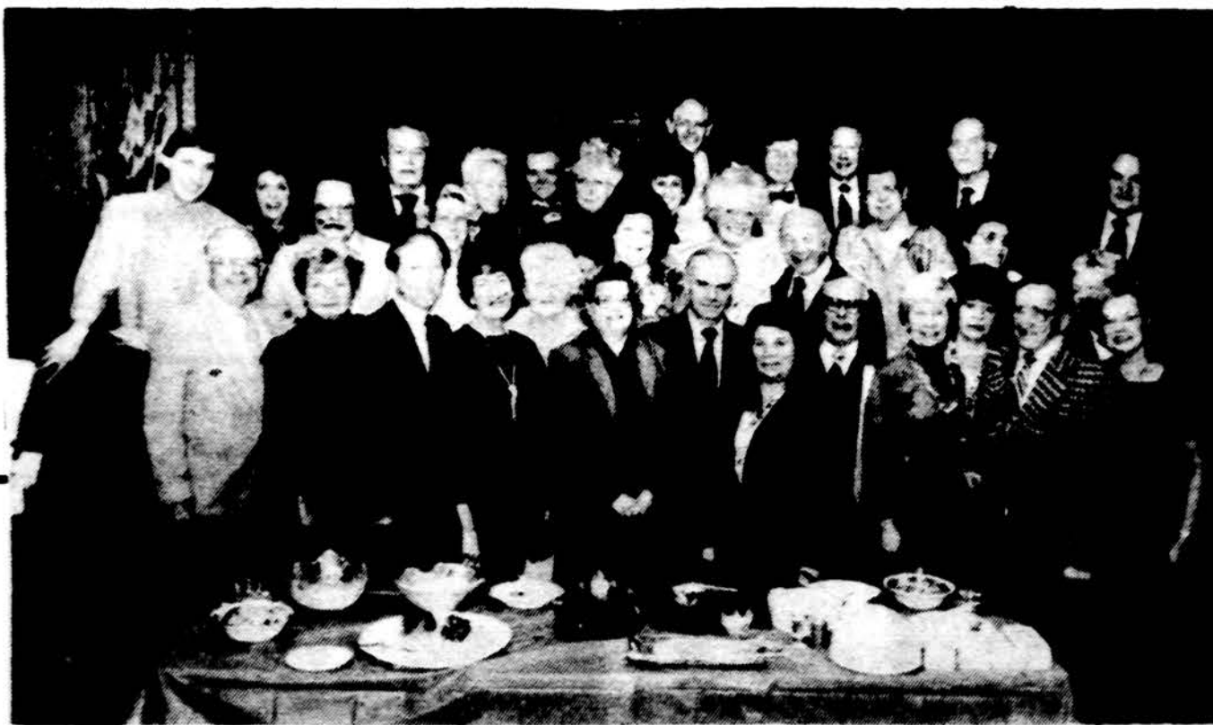
Lietuvos Vyčių Chicagoje choro nariai ir svečiai vieno pobūvio metu.