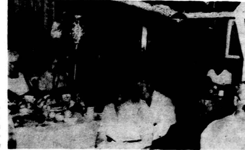
Vaisiais ir kitu sveiku maistu pensininkai sotinasi – vaisinasi Alvudo pažmonyje Lietuvio sodyboje.

SPECIALISTAS CHIRURGAS Priklauso Holy Cross Igoninai 2700 W. 43 St., Tel. 927-3231 Kalbame lietuviškai Val. pagal susitarimą pirm., antr. Ketv. ir penkt. nuo 3-7 v.v.