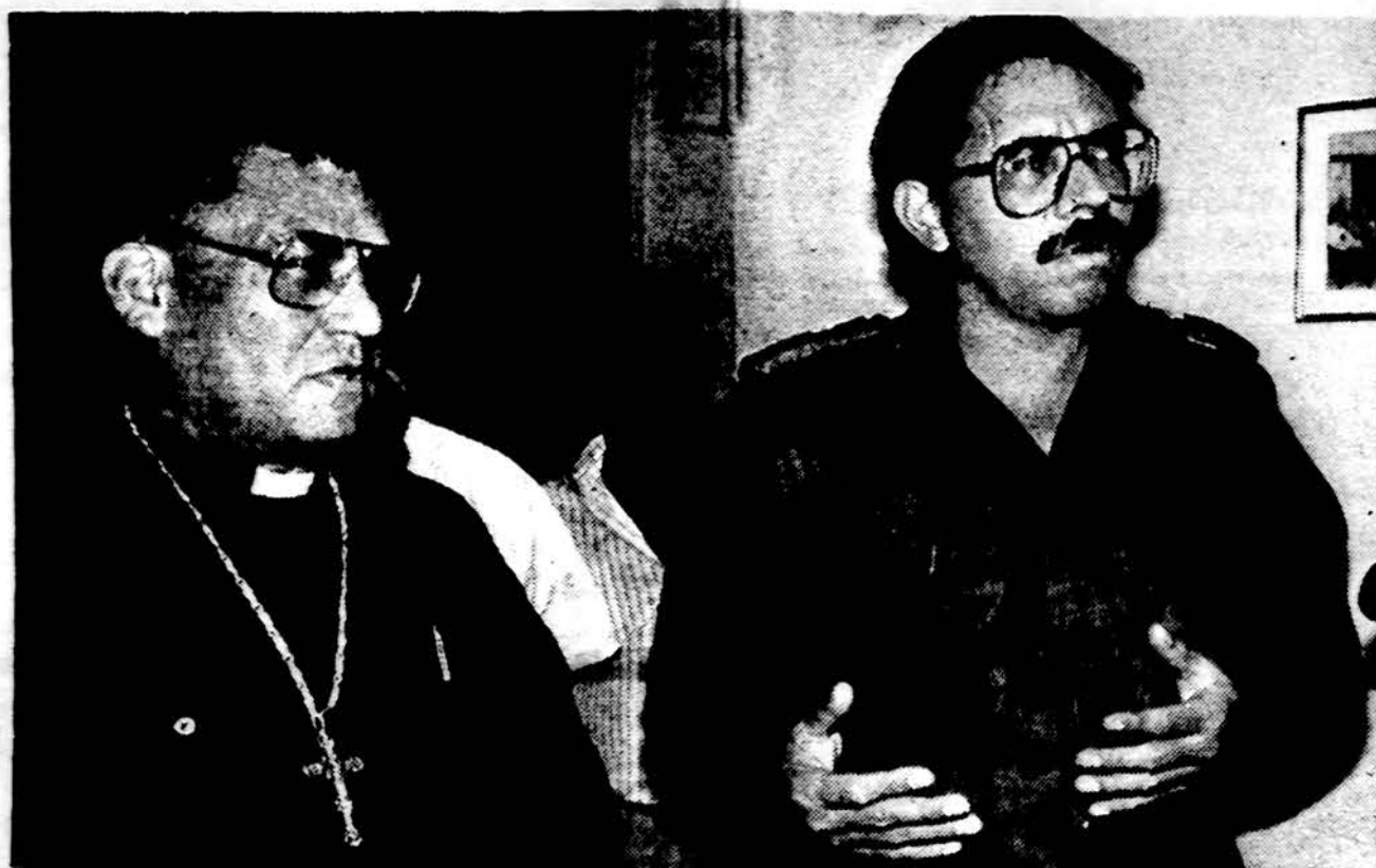
Kardinolas Miguel Obando y Bravo, Nikaragvos primas, su prezidentu Daniel Ortega, kai kardinolas sutiko tarpininko rolę, kad būtų padarytos ginklų paliaubos tarp Contras kovotojų ir sandinistų.

Neužtenka retorikos Centro Amerikos politiniai vadai pripažįsta, kad sandinistai padarė kelis žingsnius taikos link, tačiau nepakankamai. Costa Ricos prez. Oscar Arias, kurio planas buvo priimtas Gvatemalėje, Ortigos pranešimą pavadino pozityviu žingsniu Centro Amerikoje, bet jis pasakė: „Retorika yra vienas dalykas, bet išpareigojimas taikai — kitas dalykas“. Sandinistai dar daug turi padaryti, kad įgyvendintų kartu pasirašytą taikos planą. Reagano administracija pareiškė savo pasitenkinimą, jog sandinistai sutinka nors su ne-