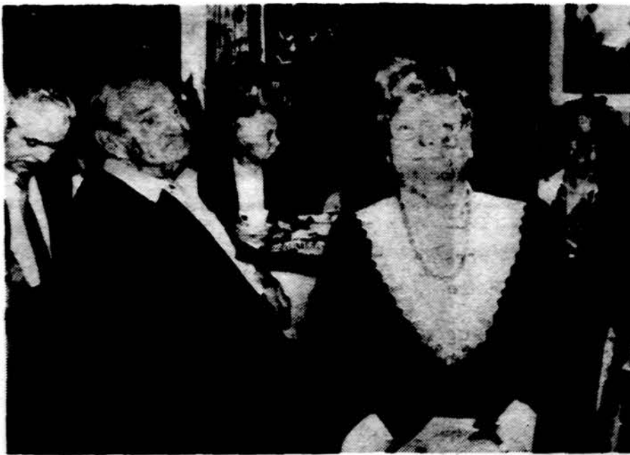
Alvudo pažmonyje Lietuvio sodyboje pensininkai seka sveikatos reikalą pranešimą.

Nepamirština, kad tik žymus cholesterolio perviršiaus sumažinimas atitolina širdies ataką. O turėti širdies ataką ar jos išvengti yra labai didelis skirtumas. Todėl atsakykime, lietuviai, gyvulinių riebalų, saugodami savas širdis nuo sklerozės. Jų vietoje tik naudokime