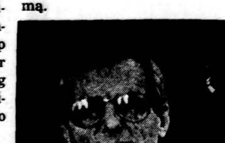
Frank C. Carlucci, Saugumo Tarybos viršininkas, kurį prezidentas nominavo Gynybos sekretoriaus pareigoms, kai iš jų pasitraukė Caspar Weinbergeris. Senatas jau pradėjo jį aplausinėti. Numatomas jo greitas patvirtinimas.

- Washingtono prez. Reaganas vėl pakartojo pažadą padėti Filipinams kovoti su komunistinėmis jėgomis, nors dabartiniai biudžeto suvaržymai labai ap sunkina tokios paramos davimą.