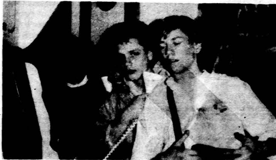
Kun. A. Lipniūno kuopos nariai „Worlds Alive“ parodoje, Techny, IL.