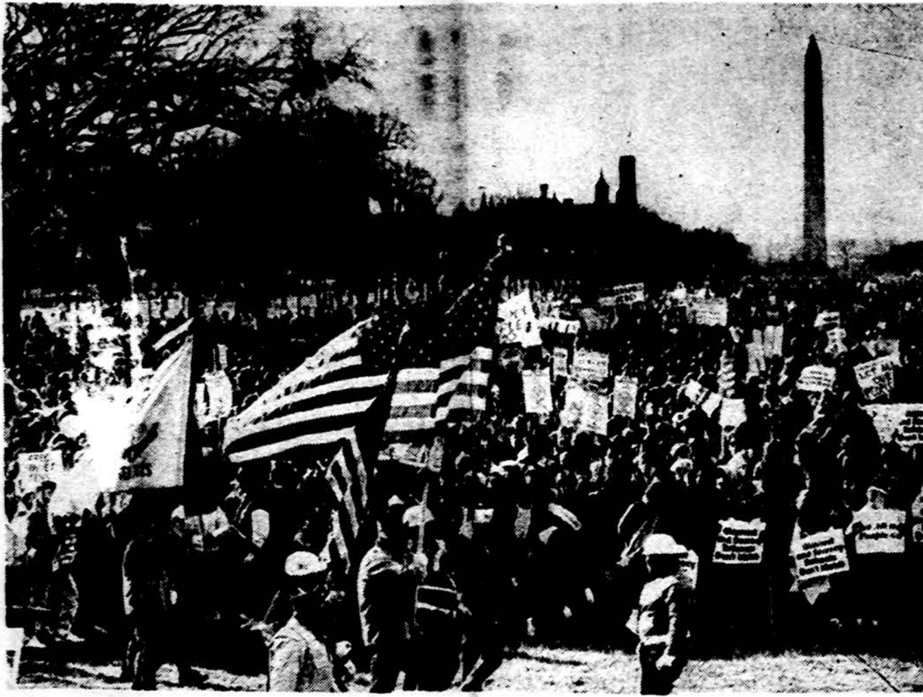
Demonstrantų minia Washingtono praėjusį sekmadienį prieš Gorbačiovi atvykstant į Ameriką.

Kategoriškai atsisakau: 1. Vyksti į Afganistaną, nes šį karą laikau grobiškiu; 2. tarnauti Černobylyje, kadangi į ten įstatymiškai vyksta tik savanoriai. Esu tikintis, todėl apmokymo metu reikalauju sudaryti