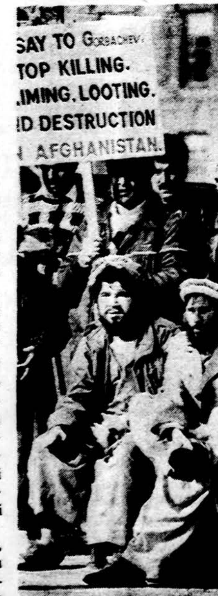
Afganų demonstrantai protestuoja prieš Sovietų Sąjungos Afganistano okupaciją sekmadienį Lafayette Parke Washingtono.