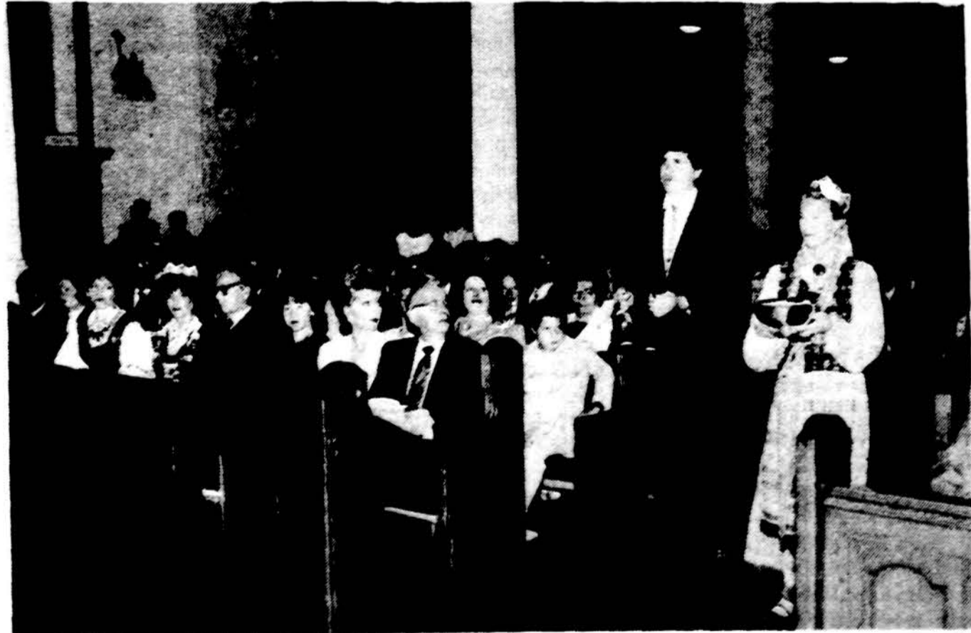
Šv. Vibianos katedroje Los Angeles Lietuvos krikšto minėjime jaunimas neša aukas prie altoriaus.

VILNIAUS ARKIVYŠKUPIJA. II dalis Šioje V-to t. II-je dalyje aprašyta Vilniaus arkivyskupijos istorinė ir jos dabartinė padėtis; apžvelgiama Bažnytinės provincijos priklausomybė kitoms valstybėms, santykiai su lenkais. Čia aprašomos ne tik dabartinės Lietuvos, bet ir sovietinėje Gudijoje administruojamos bažnyčios, paminklai, vokiečiai, valstybės, kumigai... Architektūrinę ypatybę aprašymai yra dr. Inz. Jurgio Gimbutis. 622 pol. 783 Ilustr., kieti viršeliai, gerai paruoštas leidinys. Išleido Am. Lietuvių Bibliotekos Leidykla (Lithuanian Library Press). Tieksta rinkos Drago spaustuveje. Atspausdino Morkūno spaustuve. Kaina su persiuntimu $22.98. Užsakymus siųsti: DRAUGAS, 4545 W. 63rd St. Chicago, IL 60629 USA Illinois gyventojai moka $24.00