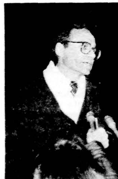
Kongresmenas John Miller