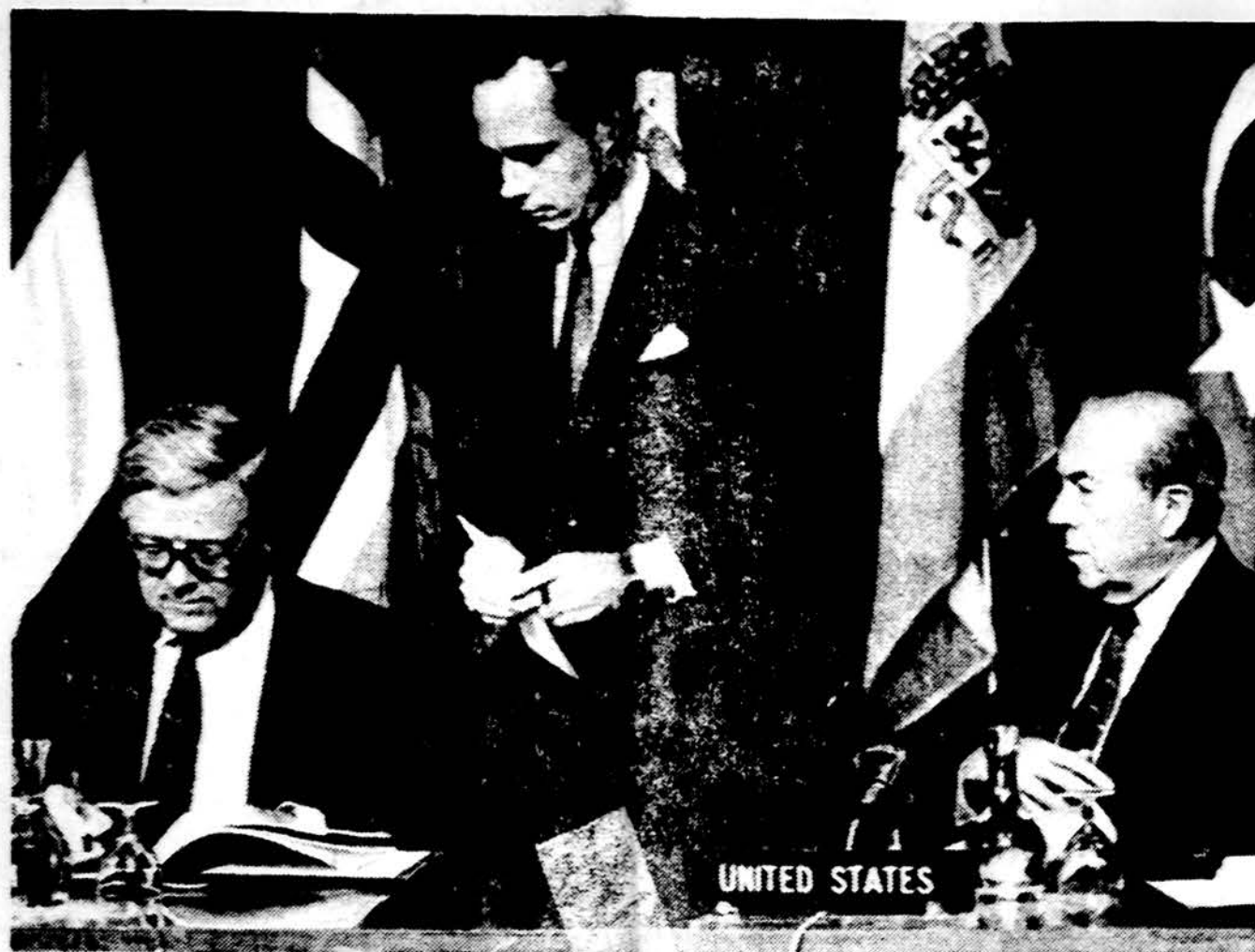
Sir Geoffrey Howe, kairėje, Britanijos užsienio reikalų ministeris, pasirašo dokumentą Briuselyje, kad sutinka leisti sovietams inspektuoti raketas, kurias ten laiko Amerika. Dešinėje pasirašoma stebi JAV Valstybės sekretorius G. Shultz. Centre – vienas iš padejėjų.

Asmuo gali atsiminti tam tikrą epizodą savo gyvenime, bet gali pamiršti, jei yra klausiamas