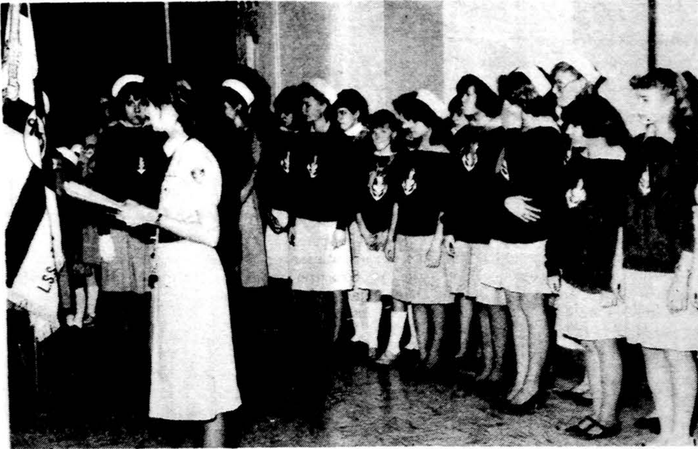
„Nerijos“ jūrų skaučių tunto iškilmingoje sueigoje.