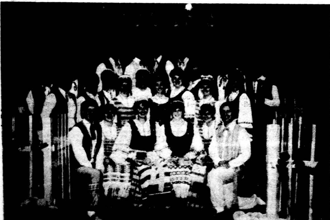
„Spindulio” tautinių šokių grupė po spektaklių per Milwaukee tautybių mugę, Milwaukee.

savonariai talkininkai) turėjo prisiseigę festivalio suprojektuotą ženkluką su vytimi. Buvo nuostabu matyti tiek daug nelietuvių, prisiseigusį festivalio vyteles.