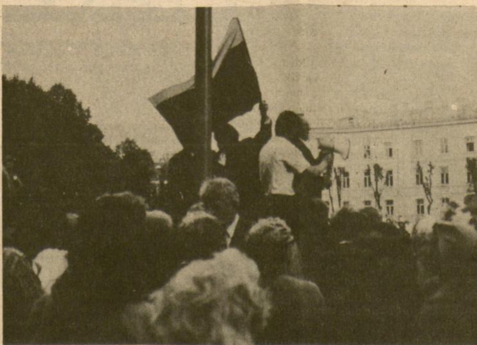
Vaidai iš Birželio įvykių minėjimo Vilniuje šių metų birželio 14 dieną.

Tačiau, paskaitininko nuomone, blogio negalima suabsoliutinti visos pavergtos Lietuvos mastu. Dar palyginus stipri persekiojama, kovojanti ir kenčianti Bažnyčia, jos teigiama įtaka visuomenei dar gerai apčiuopiama. Stiprus aktyvus ir pasyvus pasipriešinimas Maskvos diktatui, sovietinės kultūros įtakai, rusinimo tendencijoms. Labai rūpinamasi Lietuvos gamtos apsauga, vienintele legalia lietuviškojo pasipriešinimo pasireiškimo forma. Lietuvoje paplitusi kraštotylinė veikla, nors Maskva nuolat stengiasi ją naudoti saviems tikslams. Skiriamas didžiulis dėmesys paminklų apsaugai. Labai auga susidomėjimas savo krašto ir tautos istorija. Lietuvoje aukštą lygį yra pasiekusi dvasinė kūryba, kuri reiškiasi literatūroje, muzikoje, mene. Stengiamasi visais įmanomais būdais stiprinti Lietuvos ryšius su vakarietiškoja kultūra. Todėl kiekvienam turi būti aišku, kodėl reikia stiprinti ryšius su užsienio kraš-