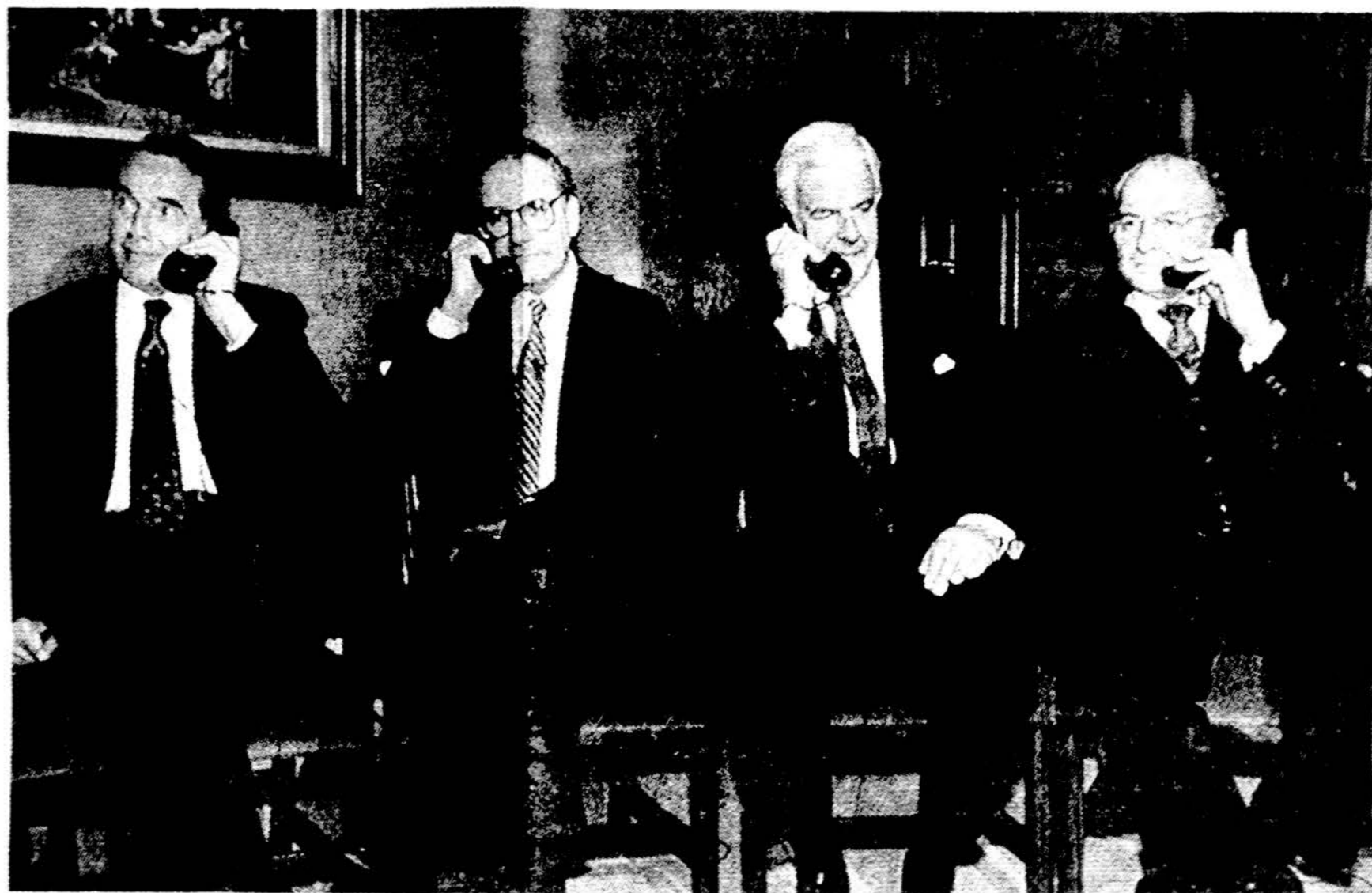
Šimto pirmojo Kongreso vadai informuoja prezidentą Reaganą, kad jie yra išrinkti vadovauti naujam Kongresui. Iš kairės matyti sen. Bob Dole, mažumos vadas, ir sen. George J. Mitchell, daugumos vadas, toliau kongr.

Visa tai nesuderinama su bet kokiu žmogiškumu. Tokios sistemos, kuri kėsina į tautų ir žmonių gyvybę ir laisvę ka- riuomenės nariu būti negaliu. (Bus daugiau)