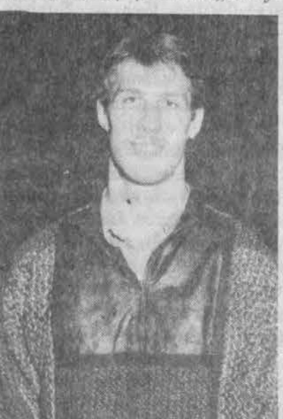
Šarūnas Marčiulionis, Vilniaus „Statybos“ pažiba.

Arvydas Sabonis, Kauno „Žalgirio“ ir Sovietų Sąjungos krepšinio rinktinės žaidėjas, pripažintas 1988-tųjų metų geriausiu Europoje krepšinininku. Antroje vietoje – Šarūnas Marčiulionis, Vilniaus „Statybos“ žaidėjas.