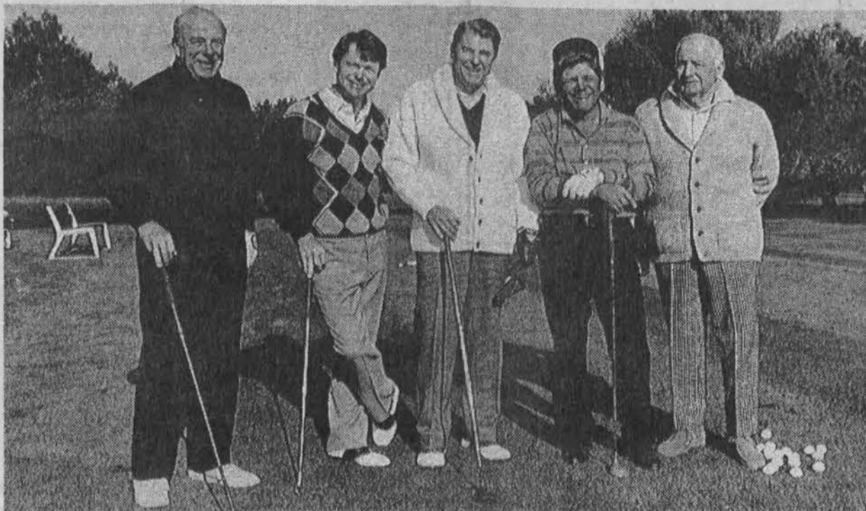
Prez. Reaganas pasirodė su draugais žaisti golfą išvakarėse, prieš sutikdamas Naujus Metus Walterio Annenbergo namuose Palms Springs, Kalifornijoje. Prezidento kairėje matyti Lee Trevino ir šeimininkas W. Annenberg, o jo dešinėje Tom Watson ir George Shultzas. Kai prezidentas baigs savo terminą, jis apsigyvens Bel Air sekcijoje prie Los Angeles miesto.

Eina nuo 1972 metų Perskaitęs duok kitam! Jei gali, padaugink!