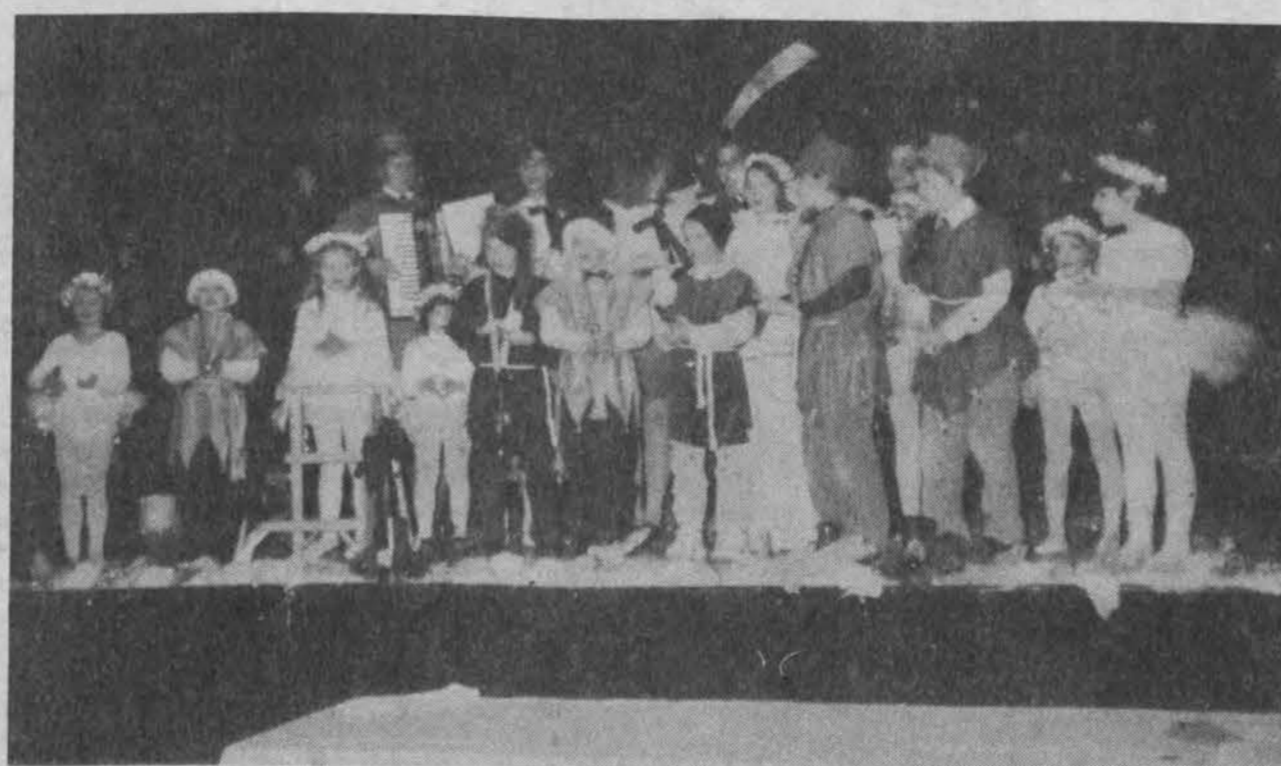
Jaunieji „Kalėdų sapno“ aktoriai Chicagos ateitininkų Kūčiose.

Tegu ši liepsnelė sušildo mūsų širdis...”