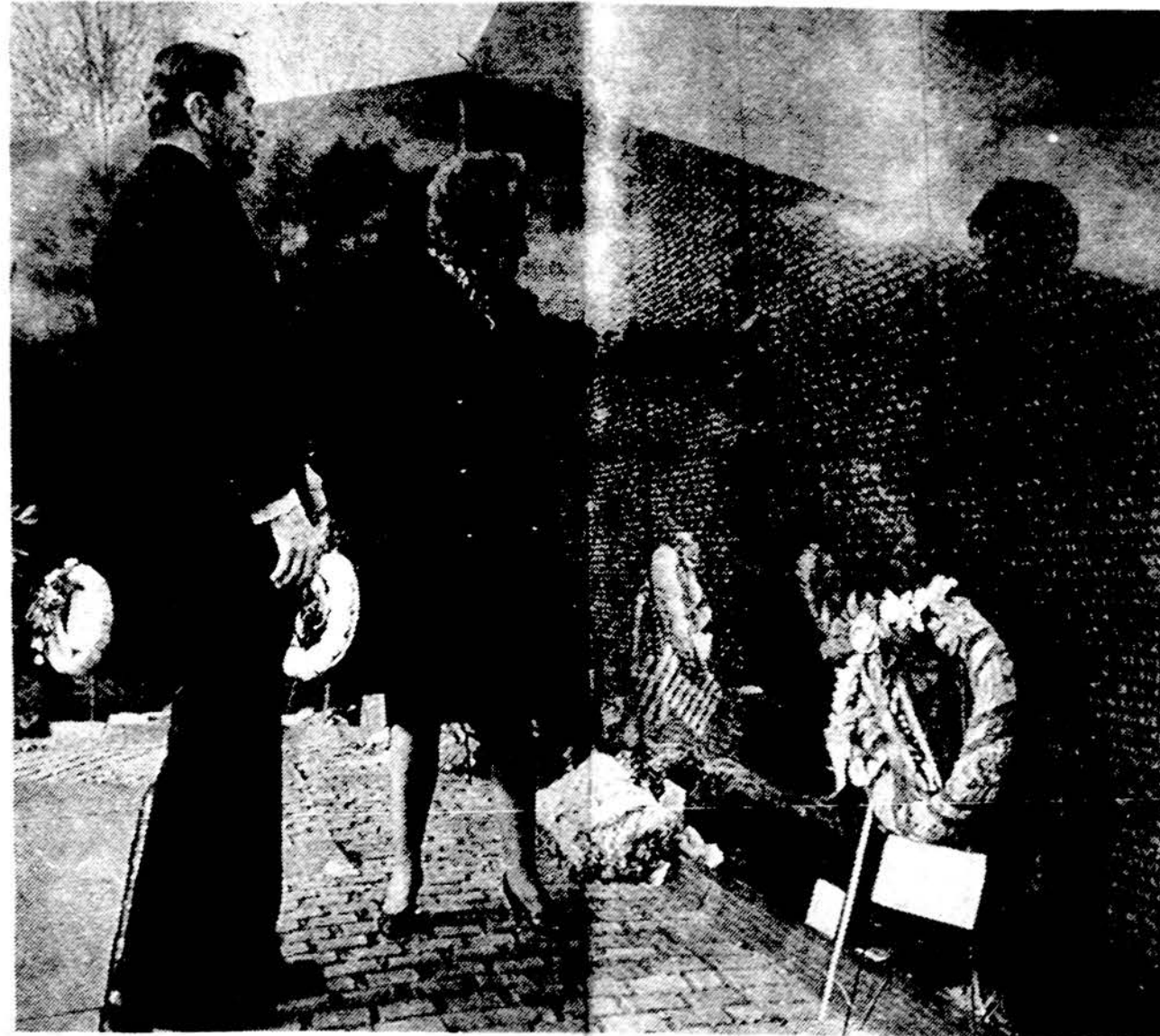
Prezidentas Reaganas su žmona Nancy prie Vietnamo karo veteranų paminklo Washingtono, ant kurio yra išrašytos Amerikos žuvusių karių pavardės. „Kas gali abejoti, jog šie kariai kovoję už žmonių teises?“ — klausė prezidentas.

— Jugoslavijos ministeris pirmininkas Branko Mikuliz, kaip praneša AP agentūra, ir jo visas kabinetas atsisitvino iš pareigų.