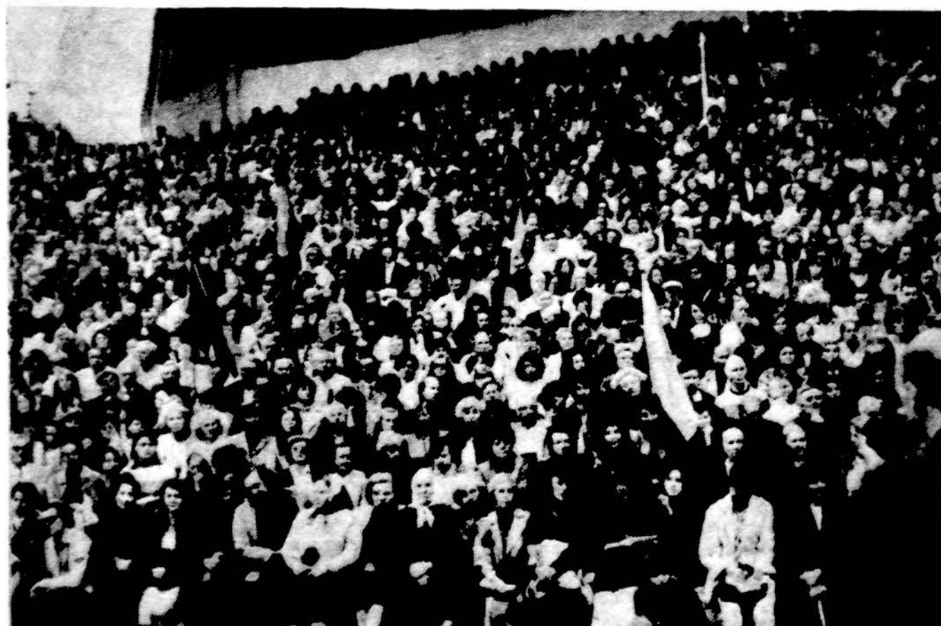
Minia Vilniuje prie Gedimino kalno.

Darbo val. nuo 9 iki 7 val. vak. Šeštad. 9 v. r. iki 1 val. d.