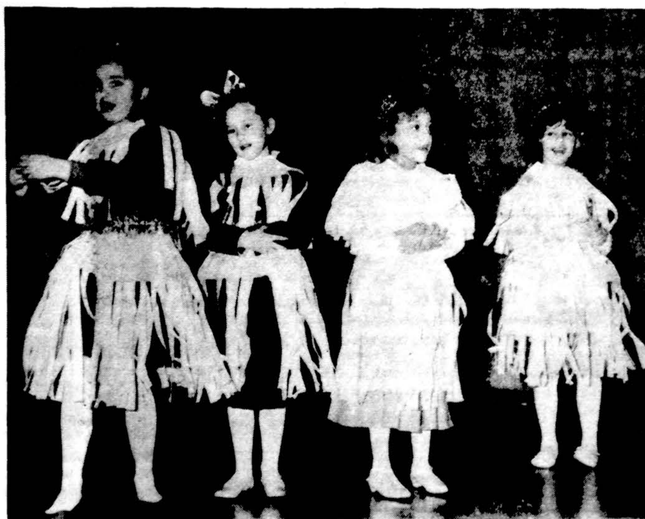
Kaledų snaiges Kr. Donelaičio eglutės programoje.