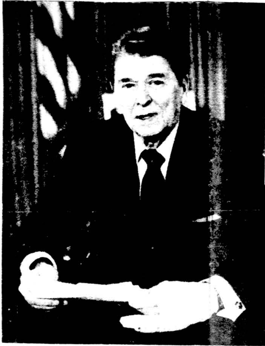
Jungtinių Amerikos Valstijų prezidentas Ronaldas Reagas atsisveikina su amerikiečių tauta.

— Pietų Afrikos prez. Botha vizituoja Dramblio Kaulo Kranto valstybės prezidentą Felix Boigny. Paskutiniu metu prez. Botha jau ne kartą lankosi juodųjų valdomuose kraštuose.