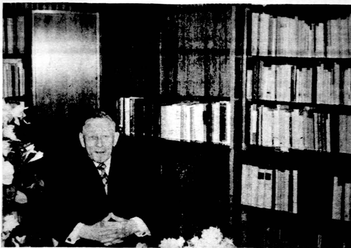
Prof. Antanas Maceina tarp savo pamegtų knygų.

„Ar atsimentate, kaip Lietuvos je būdavo giedami vad. „Panos Marijos džiaugsmai ir skausmai“? Jie prasidėdavo žodžiais „Pirmą džiaugsma Pana turėjo, kai...“ ir t.t. — iš eilės iki