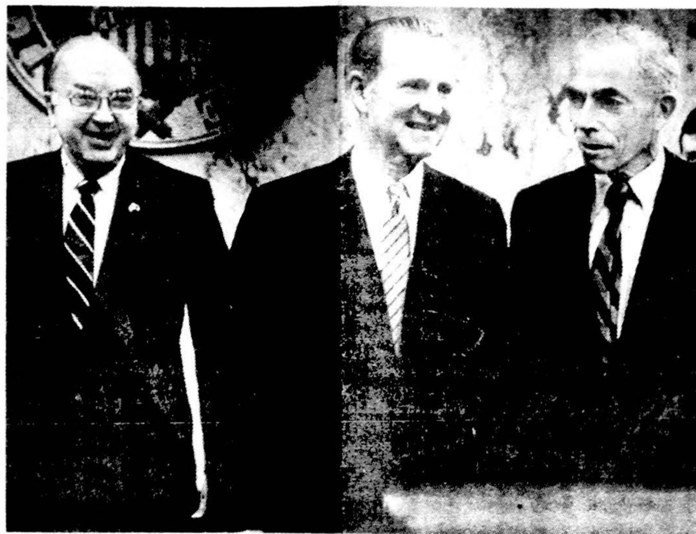
Sen. Claiborne Pell, Senato Užsienio reikalų komiteto pirmininkas, dešinėje, parodo vietą nominuotajam Valstybės sekretoriui James Baker III, prieš pradėdam Senatą apkalbinėjimus. Kairėje sen. Jesse Helms. Po to senatoriai pareiškė esą labai patenkinti jo atsakymais ir jo patvirtinimui nebus jokių kliūčių.

– Jeruzalėje Izraelio trys kareiviai sumušė ir suareštavo palestinietį vyrą, kuris ėjo kartu su žydų mergina.