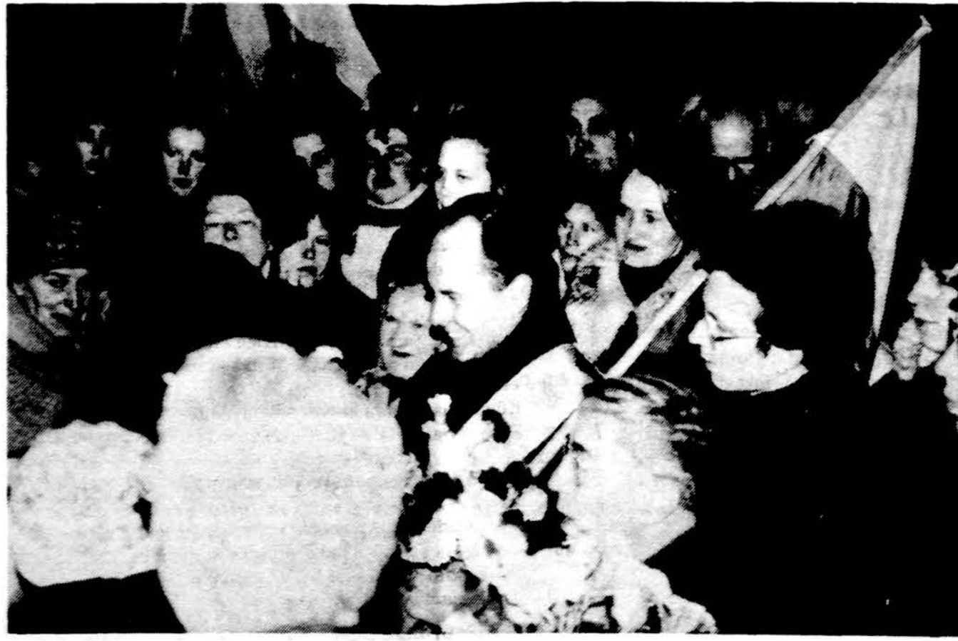
Sibiro tremtinys kun. S. Tamkevičius sutinkamas Vilniuje.