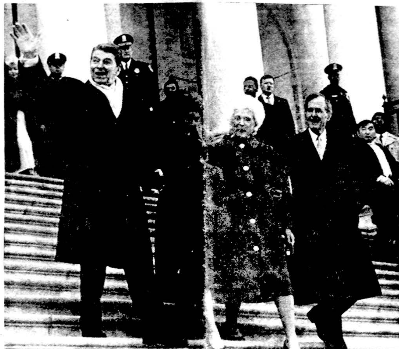
Demokratiškas vyriausybės pasikeitimas. Buvus prez. R. Reaganas ir jo žmona Nancy išlydimi iš Kapitoliūso rūmų naujojo Amerikos prezidento G. Busho ir jo žmonos Barbaros. Tai vaizdas, kokio nėra buvę Sovietų Sąjungoje.

— Belgrade žinių agentūra pranešė, jog naujuoju Jugoslavijos ministru pirmininku paskirtas gyventojų mėgstamas Kroatijos provincijos vadas Ante Markovic, kuris yra už stiprias ekonomines reformas.