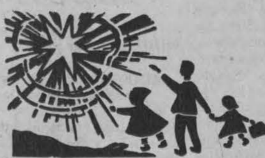
Redaguoja J. Plačas. Medžiagą siųsti: 3206 W. 65th Place, Chicago, IL 60629

x Darome nuotraukas pasams ir kitiems dokumentams, kurias galima tuojau atsiimti. American Travel Service Bureau, 9727 S. Western Ave., Chicago, Ill. 60643. Tel. 238-9787.