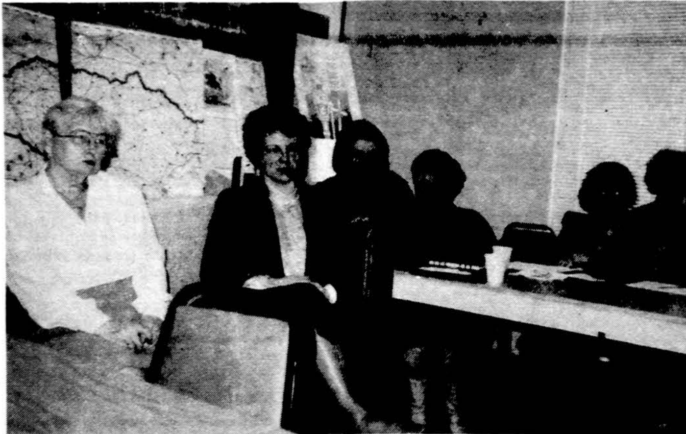
JAV Lietuvių Bendruomenės Švietimo tarybos surengtoje konferencijoje dalis klausytojų, besidomiančių priešmokykliniu auklėjimu ir darželiais.

x NAMAMS PIRKTI PASKOLOS duodamos mažais mėnesiniais įmokėjimais ir prieinamais nuostūduosius. Kreipkitės į Mutual Federal Savings, 2212 West Cermak Road – Tel. V17-7747.