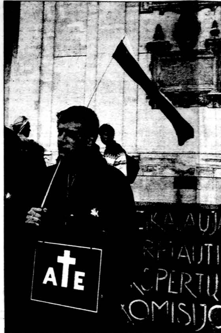
Lietuvių jaunimas demonstruoja prie Ignalinos branduolinės jėgainės, reikalaujantis tarptautinio patikrinimo. Lietuvoje, reikalaujanti tarptautinės inspekcijos, petičija pasirašė 300,000 žmonių, kadangi jėgainėje vis pasikartoja gedimai.

Civiliai apsirengę saugumiečiai, milicininkai bei raudonais raiščiais draugininkai, kurių tokia daugybė vasario 13 d. buvo atvežta iš Vilniaus ir kitų rajonų, filmavo suvažiavusius maldininkus, bet tiesiogiai pamaldų netrukė.