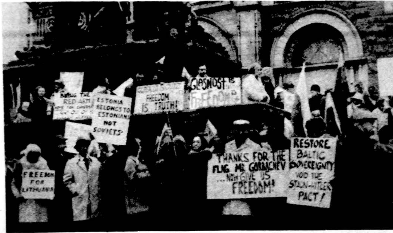
Clevelando lietuviai demonstruoja miesto centre M. Gorbaciovui JAV-ėse lankantis.