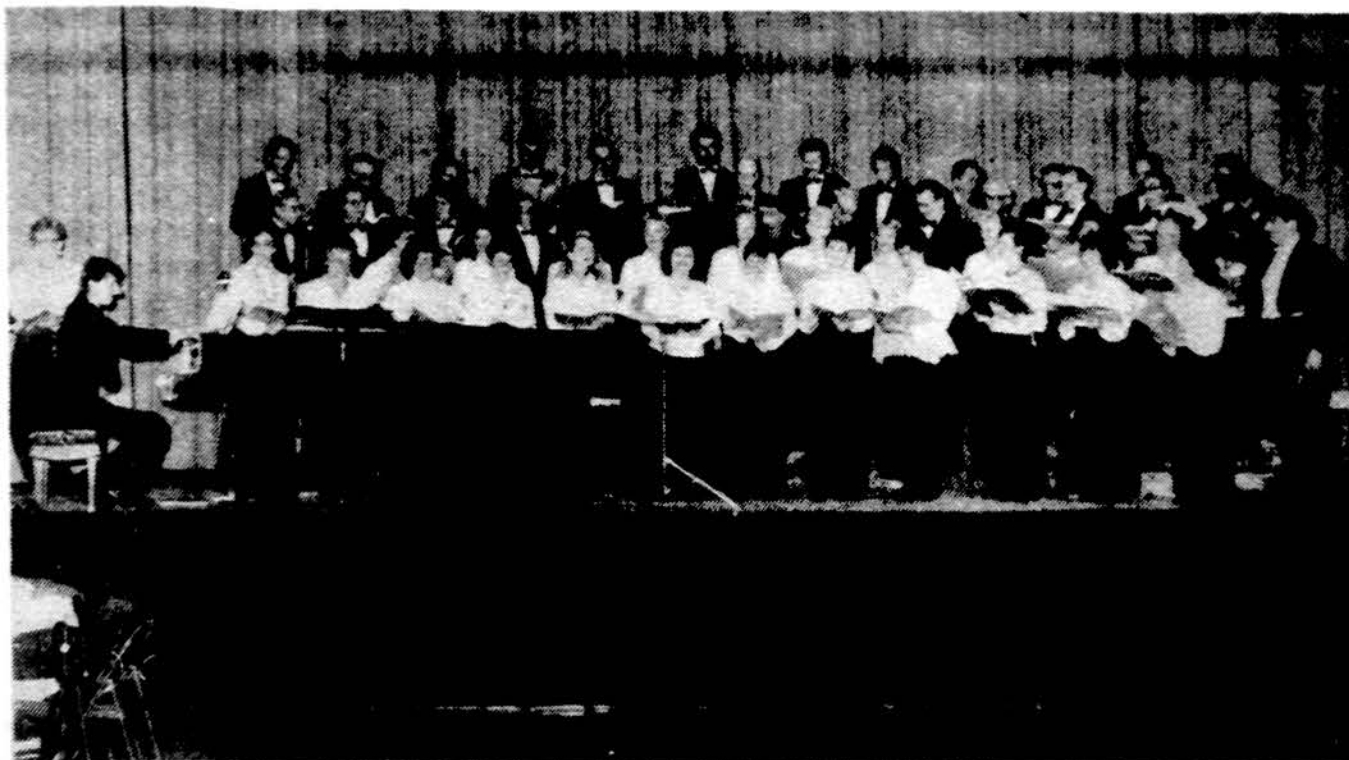
Lietuvių Operos choras, kuris „Draugo“ koncerte vasario 26 d. atliks programą.