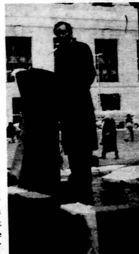
Kalba Richard Daley, kandidatas į Chicago merus.

Reikia manyti, kad ir darbai paseks tuos žodžius. Visi gerai žinome, kad didžiąją energijos dalį išeikvojame vidaus trinciai. Su atida klausomos kitų kalbos, ar neišgirs kokios priegaidės, ar kas neįkels tojos į turimą jų teritoriją. Kad rimtai politinei veiklai dažnai ir laiko nebėlieka. Kaip pavyzdį paimsiu Altos surengto Nepriklausomybės minėjimo leidinį. Leildinys reprezentacinis, malonu į rankas paimti, o direktūrai laiko gal pritrūko. Jei-