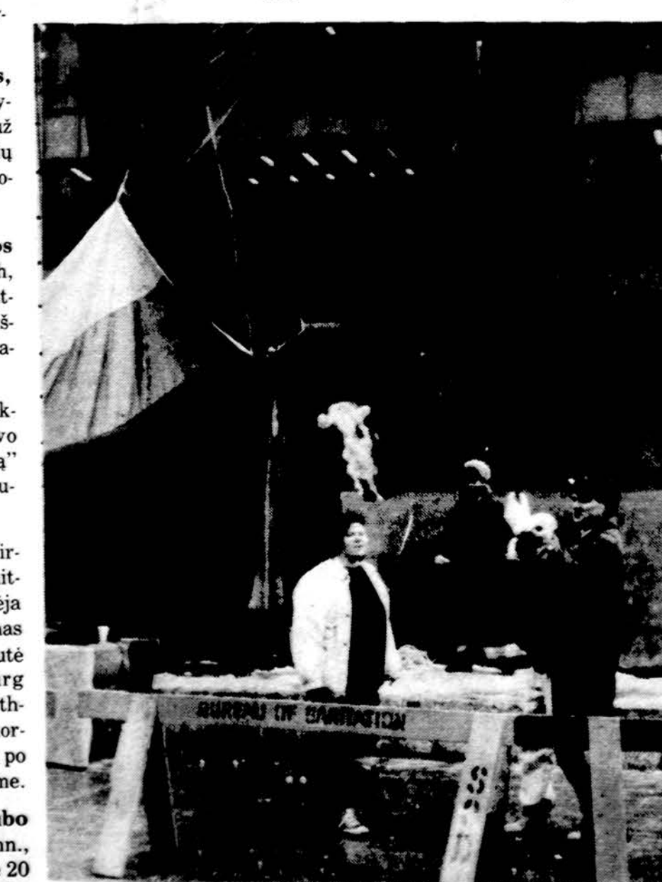
Deginama Sovietų Sąjungos vėliava demonstracijose Chicago miesto centre.

Sitame chaose buvo malonu išgirsti informaciją iš žmogaus, kuris yra informuotas. Kas savaite turi porą telefoninių pasikalbėjimų su Lietuva, taigi žmogus, kuris nevaikšto akių užsidengęs, bet informuojasi ir palaiko ryšius. Kalbasi su Laisvės lygos ir Sąjūdžio žmonėmis. Žino jų pageidavimus. I klausimus, kurie buvo iškelti, atsakinėjo logiškai ir apgalvotai. Buvo klausimų, kaip reikia žiūrėti į ryšius su Lietuva. Atsakymas, kad ryšiai sveikintini ir plėtinini, kol jie tarnauja Lietuvai, bet ne okupantui. Bendravime turi būti lygybės