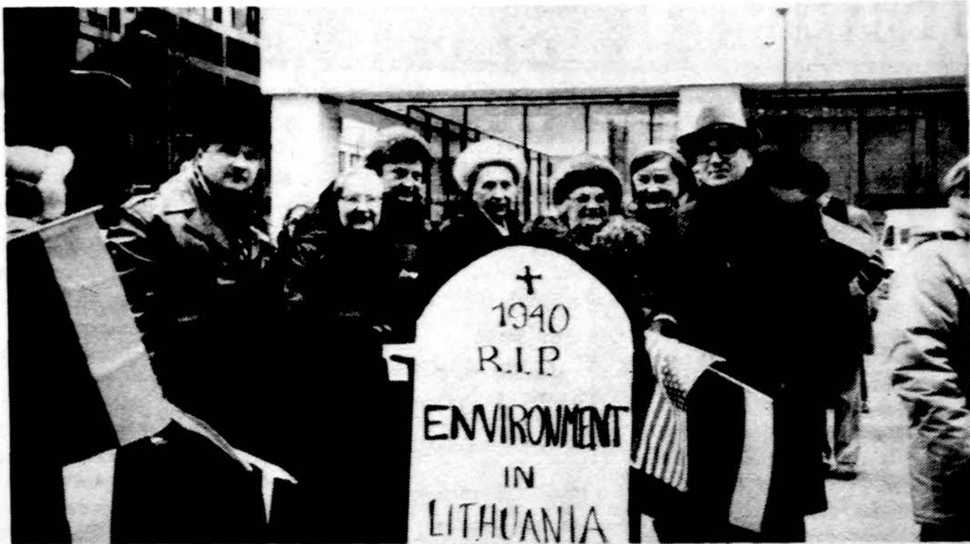
Demonstracijoje Daley Plazoje Chicagos miesto centre kunigai, seselės, būrys lietuvių.