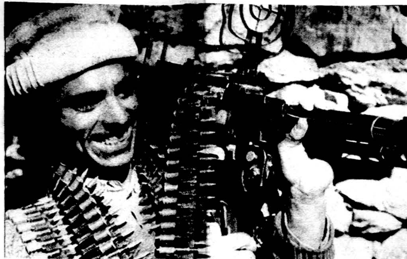
Afganistano laisvės kovotojai niekada nesiskiria su taikliais priešlėktuvinių ginklų, kurio pagalba jie nušovė daug sovietų lėktuvų. Partizanai Kunar provincijoje įsigalėjo jau prieš 4 mėnesius. Amerikos Stinger raketos — afganų partizanų mėgiamiausias ginklas.