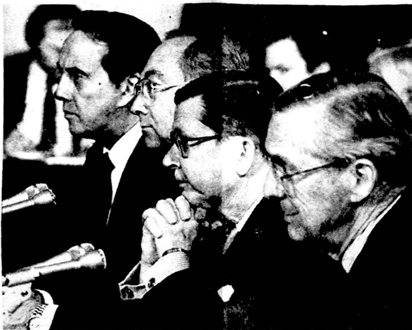
John G. Tower, antras iš dešinės, prezidento Busho nominuotas Gynybos departamento sekretoriaus pocijui, apklausinėjamu metu su senatoriais respublikonais Bob Dole ir Phil Gramm, kairėje ir demokratų senatoriumi Lloyd Bentsenu, dešinėje, kurie pasisakė už jo patvirtinimą Gynybos departamento sekretoriumi. FBI, ištyrusi Tower praeiti, nerado nieko inkriminuojančio, kad jis negalėtų būti tose pareigose.

Rašytojas Rushdie yra gimęs Indijoje musulmonų šeimoje.