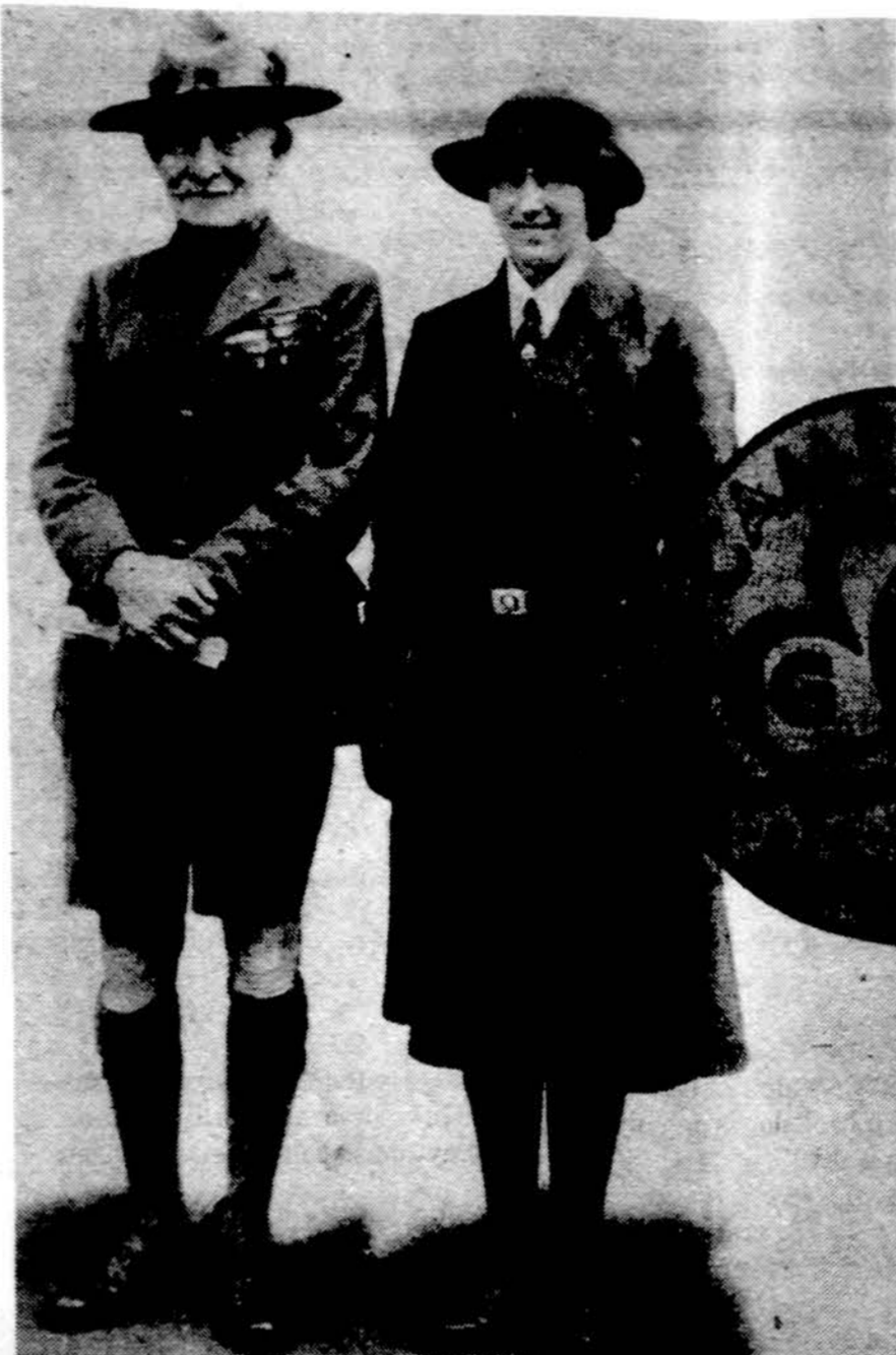
Skautybės kūrėjas lordas Robert Baden Powell ir jo žmona Olave, buvusi pasaulio skautių šefė. Abu yra gimę vasario 22 d. Pagerbiant skautybės kūrėją, vasario 22-toji skautų ir skautių visame pasaulyje švenčiama kaip tarptautinės draugystės, arba Susimąstymo diena.