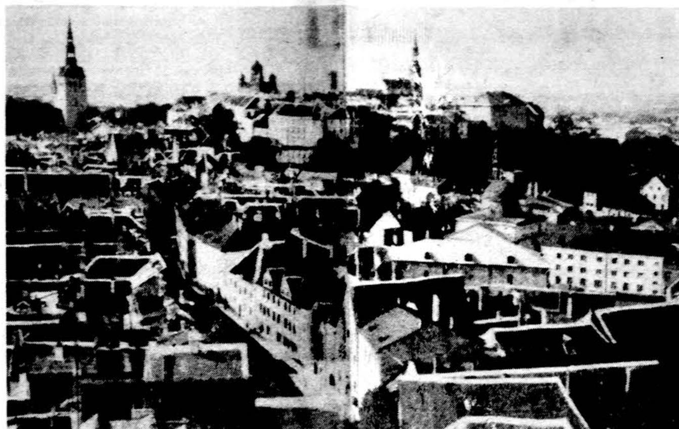
Šiandien – Estijos nepriklausomybės šventė. Bendras Estijos sostinės Tallinno prieškarinis vaizdas.

– Senato Finansų komiteto pirm. sen. Lloyd Bentsen kreipėsi į Transportacijų departamentu sekretorijai Samuel Skinner, kad įvestų griežtą kontrolę aerouostuose apsisaugoti nuo teroristų.