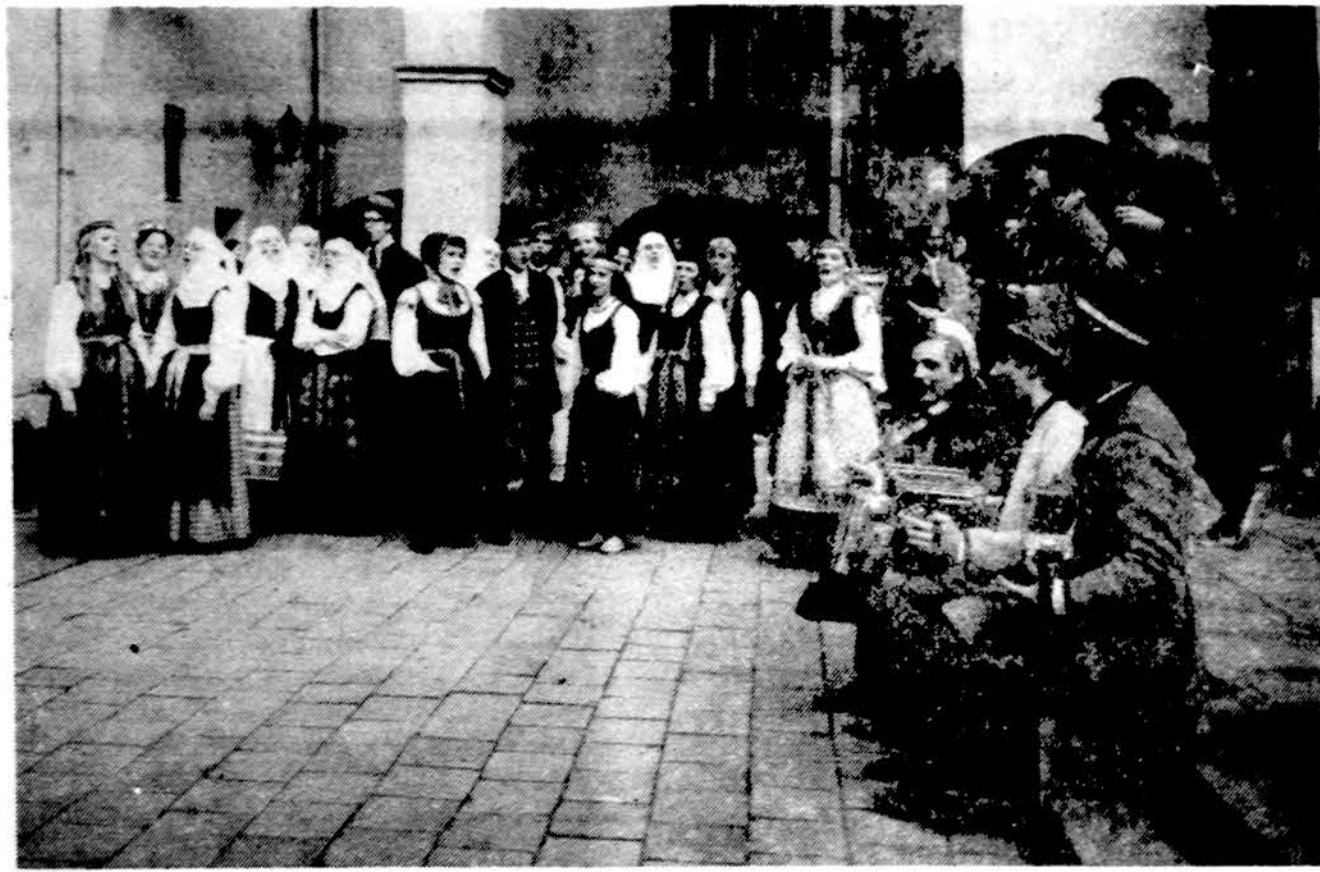
Vilniaus universiteto ansamblis „Ratilio“ universiteto kieme. Šis ansamblis balandžio mėnesį atvyks į Ameriką ir gastroluos JAV ir Kanadoje. Ansamblio koncertuos Philadelphiaje, New Yorke, Bostone, Hartforde, Clevelande, Detroite, Toronte ir Chicagoje. Gastrolės pradės balandžio 3 d.

Gražų išpudį padarė ir jaunimo šokiai, kurie vyko dabartiniuose mažuose Kultūros namuose. O kiek gražaus jaunimo buvo čia, suvažiuavusio iš visų apylinkių. Maža salė tik nedidelį kiekį šokančių talpino, kai daugumas stoviniavo koridoriuje ar lauke. O muzika ir pačių jaunuolių. Tačiau jau labai seniai nemačiau tų anų laikų šokių, tai polkučių, foksotrotų ir valsu, kuriuos jaunimas plėšė net grindys lingavo. Mūsų čionykštis jaunimas tikrai nezinotų kaip šokti ten. Susipažinau su daug jaunuolių, kurių nemažai giminių gyvena pas