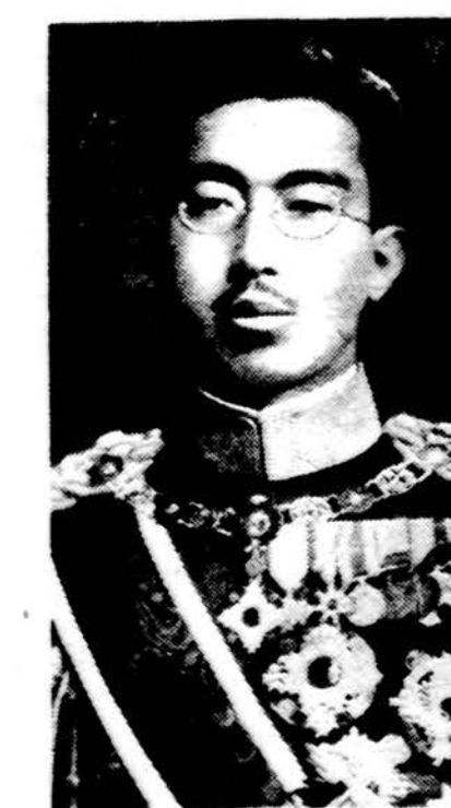
Šiandien laidojamas Japonijos imperatorius Hirohito. Nuotrauka daryta prieš 37 metus.

Saulė teka 6:35, leidžiasi 5:33. Temperatūra dieną 27 l., naktį 16 l.