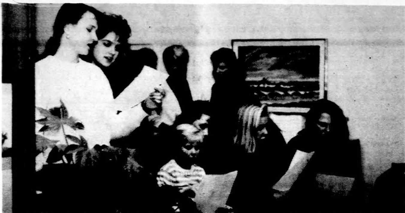
„Nerijos“ tunto sesės gieda kalėdinėje sueigoje.

Svečių dieną šiek tiek linojo. Bet ir tas lietus geras dalykas – lietus sudrekinė dulkes, todėl mažiau dulke žygiuojant. Kadangi dėl vietos, kalnuose, ugnis dėl didelio gaisro pavojaus draudžiama kurenti visą vasarą, nuo lapkričio iki vasaros, nuo lapkričio iki maždaug kovo mėn., tai „laužus“ turėjom po atviru dangum, bet be ugnies. Kažkaip trūksta dūmų ir žiežirbų! Bet toks valdžios įsakymas. Po sėkmingo lietuvių, žemei įmirkus, pakalbėjus su stovyklavietės prievaizda, buvo gautas leidimas laužą sukrauti. Čia labai darbavosi du vyčiai. Jie ne tik išgrėbė laužavietę ir sukrovė didelį laužą, bet parūpino ir dvi dideles statines vandens, vėl sudrekino visas dulkes, sąžiningai prižiūrėjo laužą, o pabaigoje jį greit