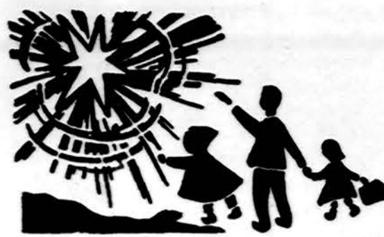
Redaguoja J. Piacas. Medžiagą siųsti: 3206 W. 65th Place, Chicago, IL 60629

x Siunčiame prekes į Lietuvą kargo. Jūsų dovanos, kaip video kameros, magnetofonai, radijo 2-ju kasečių aparatai ir kitos. Lietuvoje pagedaujamos, prekės pasiekis Vilnių per 5 dienas, saugiai ir pilnai apdraustas. Priimame prekių ir persiuntimo užsakymus ir iš kitų JAV miestų. PATRIA, 2638 W. 71 St., Chicago, Ill., tel. 312-778-2100. Sav. A. F. Šluta.